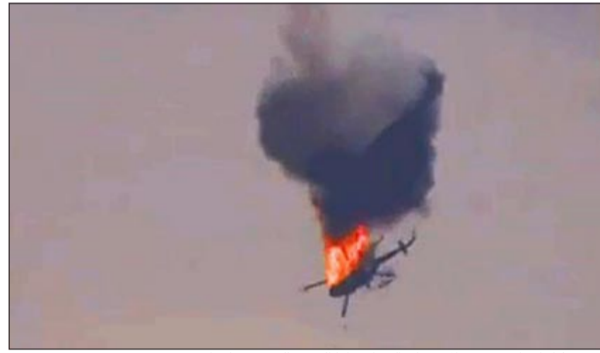
صورة بثها ناشطون لإحدى المروحيات التي اسقطها الجيش الحر في حلب امس

في حين أن المدن والقرى النائية تعرض معظمها لقصف عنيف ويومسي بالذبابات وراجمات الصواريخ ومختلف الأسلحة الثقيلة. وأحصت تنسيقيات حمص قصف 21 منطقة داخل مدينة