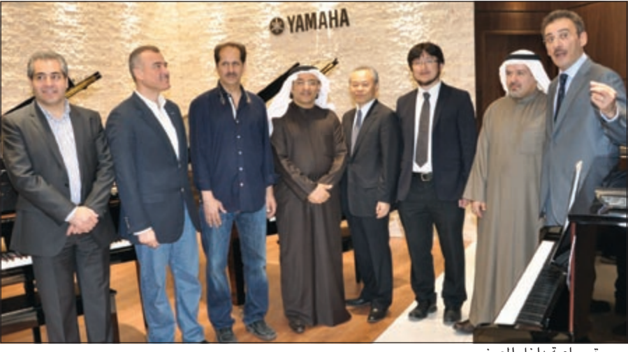
صورة جماعية داخل المعرض