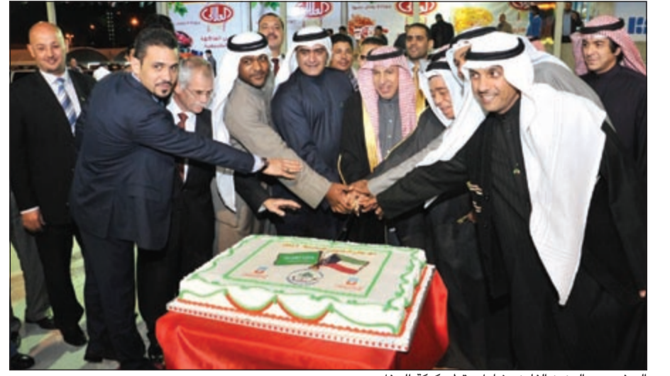
السفير عبدالعزيز الفايز يشارك بقطع كعكة الحفل