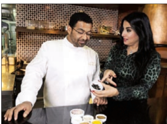
سمية الخشاب أثناء تصوير برنامجها «سمية والستات»

وتغطي حلقتا أبوظبي زيارة نجمة السينما والتلفزيون لقصر الإمارات وأبراج الإتحاد وقصر السراب