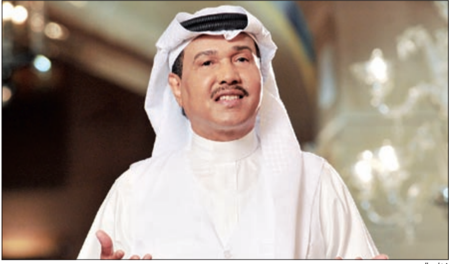
فنان العرب محمد عبده

ساعات البث الإذاعي، فيما لا تزال أغنية «الله جابك» حاطة بسرية تامة. وقالت صحيفة «الجزيرة» السعودية إن هذا الألبوم الذي يسمى بـ«المني اليوم»، يأتي ليوثق تواجد فنان العرب في الساحة الغنائية، بعد انقطاعه عن الحفلات الرسمية والحفلات الغنائية واعتذاره عن عدم المشاركة في بعض المناسبات مثل «جلسات وناسة» ونحوها.