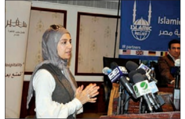
حنان ترك وفي يدها الدبلة أثناء المؤتمر

على رغم اعتزال حنان ترك الفن نهائياً، إلا أنها عادت إلى الأضواء من خلال