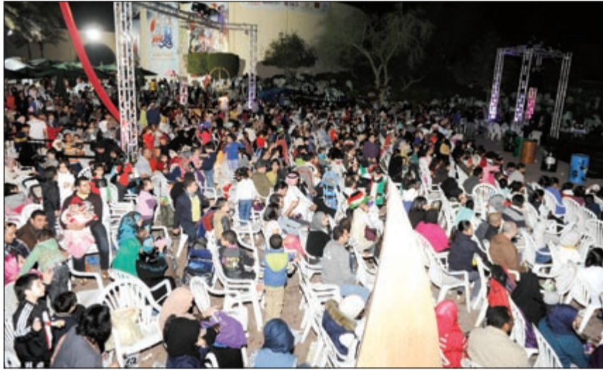
حضور كبير في الجزيرة الخضراء لمشاهدة العرض

أعلى المسرح بالحبال، وهم يعزفون على عدد من قطع السيارات القديمة، ووسط حشد الجمهور الكبير الذي