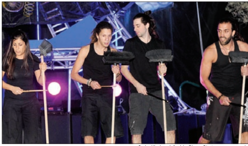
جانب من عرض فرقة Loud Arabia Show اللبنانية