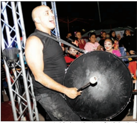
أحد أعضاء الفرقة في فقرة القرق على الطبول