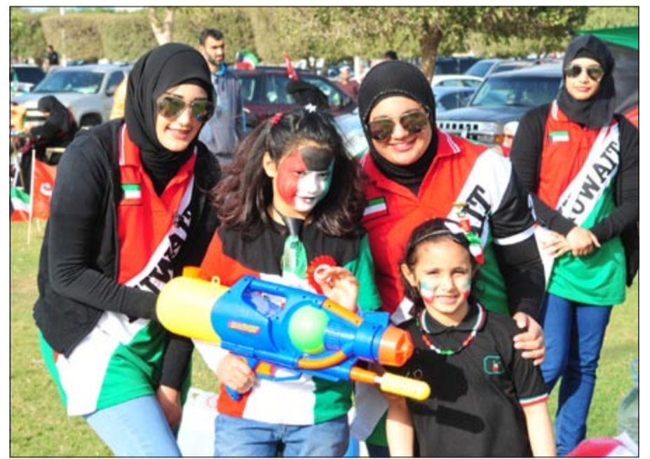
الفتيات احتفلن مع الأطفال على طريقتين

فقال: اننا نعيش خلال هذه الايام الذكرى السنوية المجيدة للاعياد الوطنية والتي تذكرنا ببهجة الحرية، ولتجدد ولاءنا وحبنا لوطننا الغالي، والتفافنا اهل الكويت جميعا حول أميرنا المفدى وحكومتنا الرشيدة يدا واحدة وقلبا واحدا يهتف باسم الكويت ولاجلها.