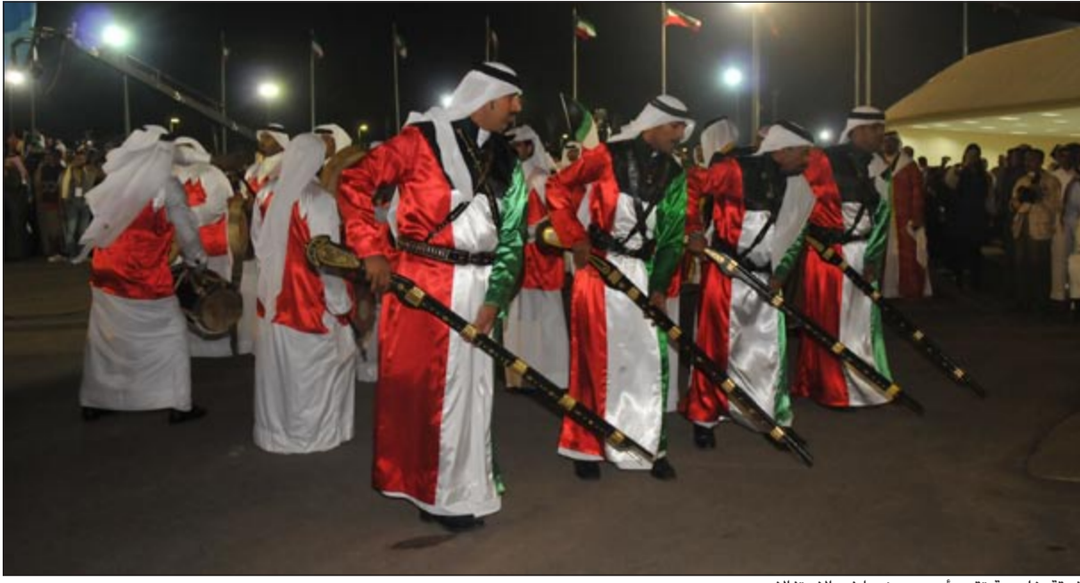
فرقة خليجية تقدم أحد عروضها في الاحتفالات