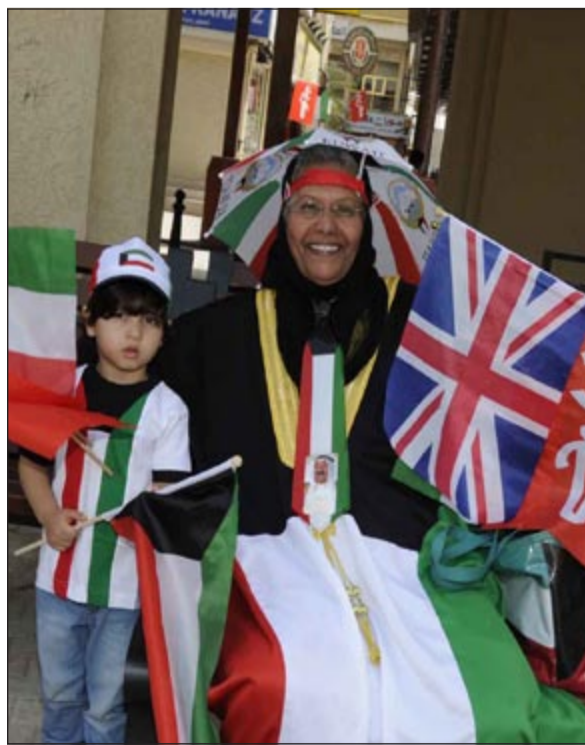
اعلام الدول الصديقة رفعت الى جانب علم الكويت