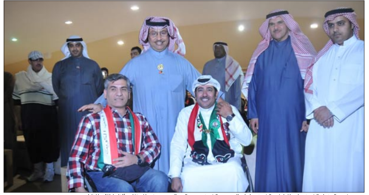
سمو رئيس الوزراء الشيخ جابر المبارك والشيخ سلمان الحمد والشيخ محمد العبدالله مع بعض المحتفلين أثناء اطلاق الناطيد