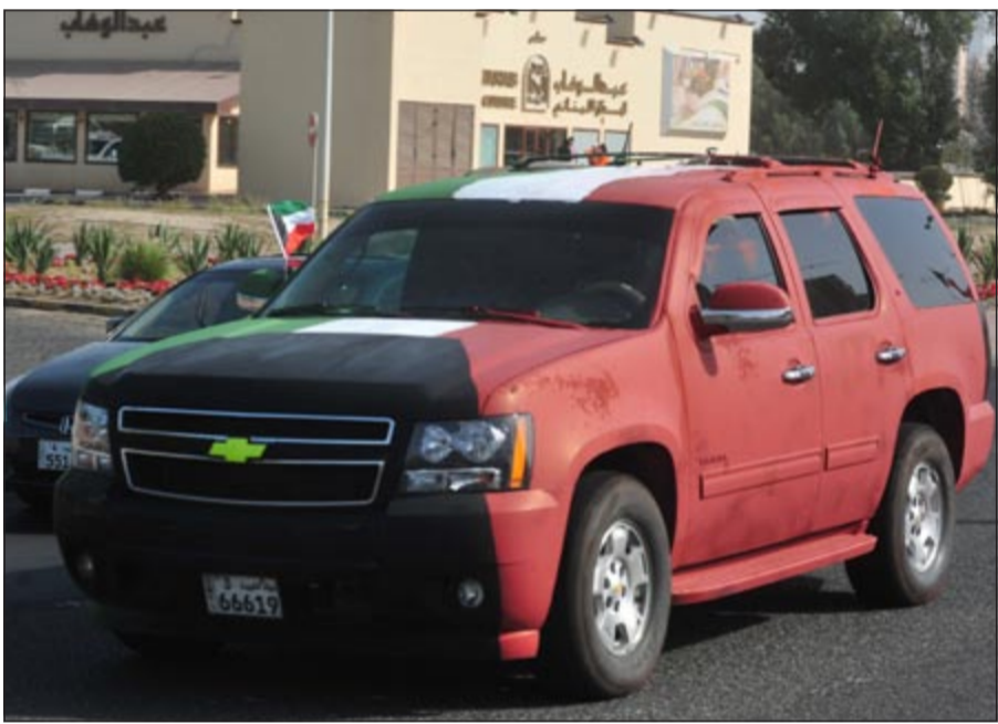
سيارة تلونت بعلم الكويت