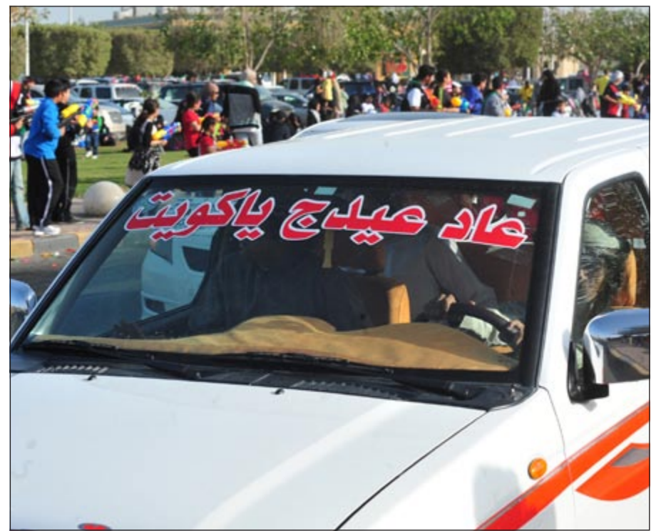
عاد عيديا كويتيا