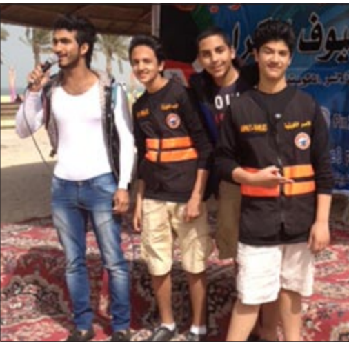
من أنشطة الاحتفال