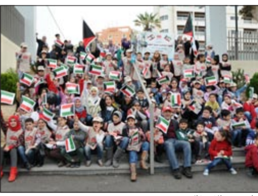
جانب من الاحتفال

احتفاء بالعيد الوطني الكويتي وذكرى التحرير وزعت مؤسسة الرحمة العالمية في الكويت عبر مكتبها في لبنان في هذه المناسبة هدايا للأطفال الأيتام الذين ترعاهم في كل المناطق اللبنانية مشاركتهم فرحة الأعياد وأقيم احتفال تخلله رقصات وأغان كويتية ومشاهد فلكلورية مزينة بالأعلام اللبنانية والكويتية ورفع صور لصاحب السمو الامير الشيخ صباح الاحمد تجسيدا للحملة الكويتية - اللبنانية، بالإضافة إلى إجراء مباراة ثقافية اختبارية فيها معلومات الأيتام عن وطنهم الثاني الكويت، فازت بسهم الفرحة على وجوههم ودعوا لأمير الكويت بالحفظ وطول العمر، متمنين للكويت أميرا وحكومة وشعبا ومؤسسات دوام الافراح والتوفيق والازدهار.