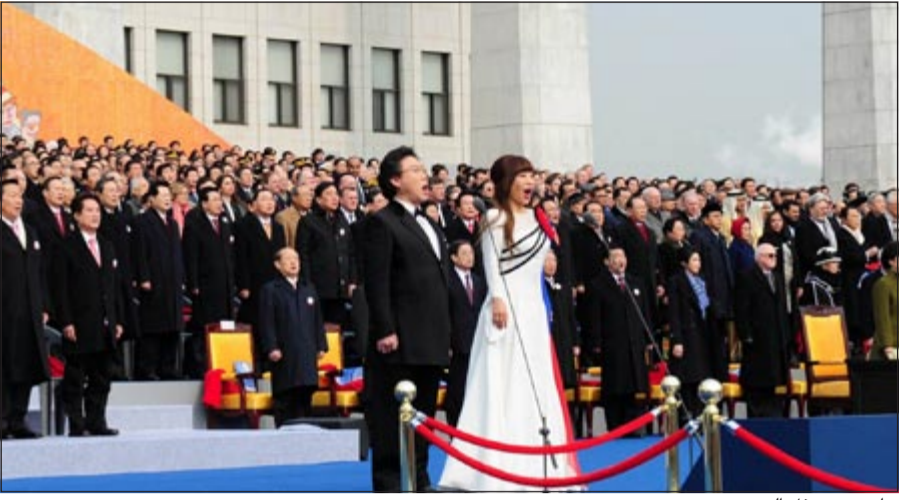
جانب من حفل التنصيب