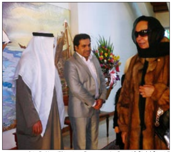
الشيخة لطيفة الفهد والسفير سعود الدويش خلال حفل العشاء

كما تفخر باحتلالها المرتبة الثانية عالمياً والأولى عربياً في محور الأمية. وأوضحت أن الحكومة الكويتية تقوم بدور بارز في تمكين المرأة اقتصادياً بتدليل جميع التحديات والمعوقات مما أهلها للمشاركة في صنع القرار في شتى المجالات التنموية لتنتقل بطموحها نحو القطاع الخاص حيث كان لها الدور المؤثر في الاقتصاد الكويتي. وأكدت أن هذه الإنطلاقة لم تات من فراغ وذلك بما هيأت لها الحكومة المناخ الملائم من التشريعات والقوانين كقانون العمل في القطاع الأهلي