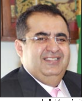
السفير عادل العيار

طوكيو - كونا: جدد مسؤولون يابانيون امس امتنانهم للكويت حكومة وشعباً على ما قدمته من مساعدات سخية ودعم مخلص للشعب الياباني بعد الزلزال المدمر في مارس 2011. وقالت رئيسة لجنة الصداقة البرلمانية اليابانية - الكويتية يوريكو كويكي في تصريحات لوسائل الاعلام «ان شعب اليابان يجب ألا ينسى أبداً مشاعر الامتنان تجاه الكويت» مضيفة ان الكويت قدمت دعماً كبيراً للمناطق المتضررة وقد شملت المساعدة الكويتية مجالات عدة. وأضافت ان الكويت قدمت تبرعات من النفط الخام تصل إلى 5 ملايين برميل أي ما يعادل 500 مليون دولار، مشيرة الى انه وخلال زيارته إلى اليابان في مارس الماضي «كشفت صاحب السمو الأمير الشيخ صباح الأحمد عن نيته بالتبرع