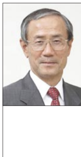
السفير عادل العيار

الكويتي ومتساوية مع الرجل كما تفخر باحتلالها المرتبة الثانية عالمياً والأولى عربياً في محور الأمية. وأوضحت أن الحكومة الكويتية تقوم بدور بارز في تمكين المرأة اقتصادياً بتدليل جميع التحديات والمعوقات مما أهلها للمشاركة في صنع القرار في شتى المجالات التنموية لتنتقل بطموحها نحو القطاع الخاص حيث كان لها الدور المؤثر في الاقتصاد الكويتي. وأكدت أن هذه الإنطلاقة لم تات من فراغ وذلك بما هيأت لها الحكومة المناخ الملائم من التشريعات والقوانين كقانون العمل في القطاع الأهلي