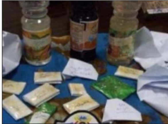
ادوات السحر بعد ضبطها في منفذ العبدلي