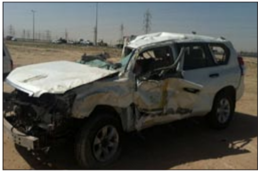
السيارة بعد تعديلها في بر الوفرة

أسعف 5 أشخاص للعلاج في مستشفى العبدان اثر 3 حوادث مرورية حدثت جميعها في نطاق محافظتي مبارك الكبير والأحمدي.