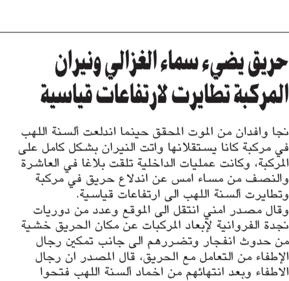
اللواء عبدالفتاح العلي

أمن مدير أمن الفروانية اللواء عبدالفتاح العلي بالتحفظ على وافدين من الجنسية الباكستانية لحسين الانتهاء من تقرير بشأن لحوم يربح بنسبة كبيرة ان تكون لحوما فاسدة وكانت بصدد بيعها من خلال مطاعم في جليب الشويخ، وكانت دورية تابعة لأمن الفروانية وخلال جولة لها رصدت مركبة متوقفة