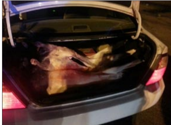
.. الخراف المضبوطة ستحال إلى الفحص

أسفل جسر الغزالي باتجاه منطقة الجليب ولدى توقف رجلي الأمن فوجئا بالوافدين يحاولون الهرب جريا على الأقدام تاركين الجمل بما حمل «اي تاركين السيارة التي كانا فيها». وقال مصدر امني تم مطاردة الوافدين وتوقيفهما وبتفتيش السيارة عثر بداخلها على 3 خراف متبوحه خارج المسلخ، كما تبين ان