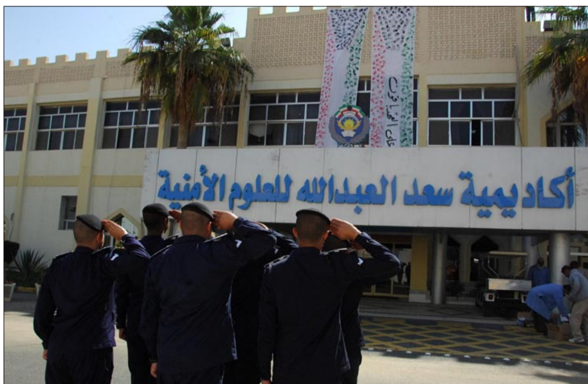
ضباط الأكاديمية يؤدون تحية العلم

الوطنية وحب الوطن لديهم والتي جاءت على أرض الواقع بهذه المساهمة من شبابها المخلصين من الطلبة الضباط في الأكاديمية سعد العبدالله للعلوم الأمنية (كلية الشرطة) وقد تزينت الأكاديمية بالعلم وحمل كلمة «على العهد بأقون» تعبيراً عن مدى الحب والوفاء والإخلاص الذي تفيض به أفئدتهم لبلدهم الحبيب الكويت والذي يقدمون له أرواحهم وكل ما هو غال ونفيس فداء له ولرفعتهم دائما أمام العالم أجمع في ظل حضرة صاحب السمو الأمير الشيخ صباح