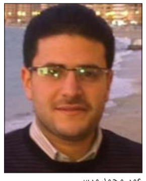
عمر محمد مرسي

وحصل الحزب على 40% من الاصوات في الانتخابات التشريعية التي أجريت العام