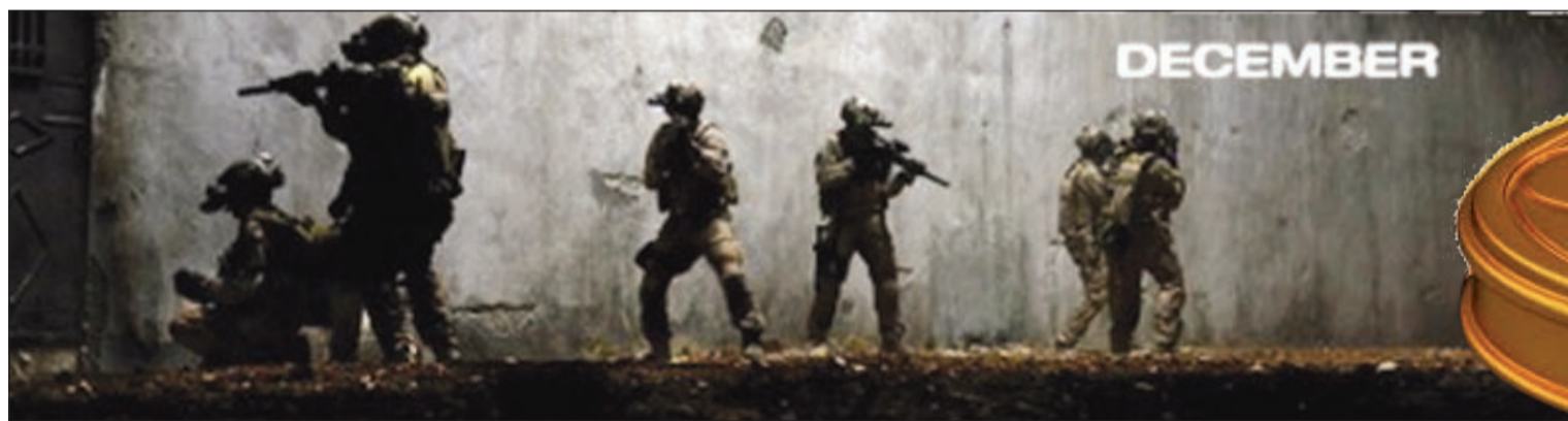
إحدى لقطات فيلم «30 دقيقة بعد منتصف الليل»

فترة الانتخابات الرئاسية وسط اتهامات متبادلة بين الديمقراطيين والجمهوريين وكذلك بالنسبة لصورة الاستخبارات الأميركية وكيفية وصولها لمتغابها بطرق أقل مما يقال فيها بأنها غير إنسانية. فأوسكار العام مصبوغ