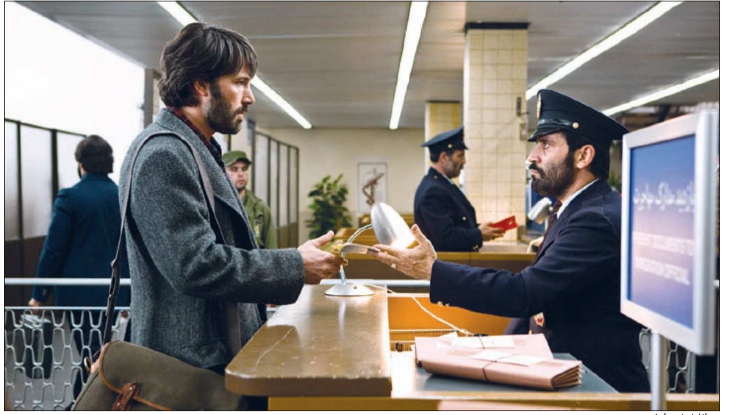
بن أفليك في «ارغو»

المنافسة الأساسية لـ «هاثاواي» هي إيمي ادامز والتي تجسد دور زوجة البروفيسور في فيلم «المعلم» لما حملته شخصيتها في الفيلم من صعوبة واضطرابات أدتها بكل