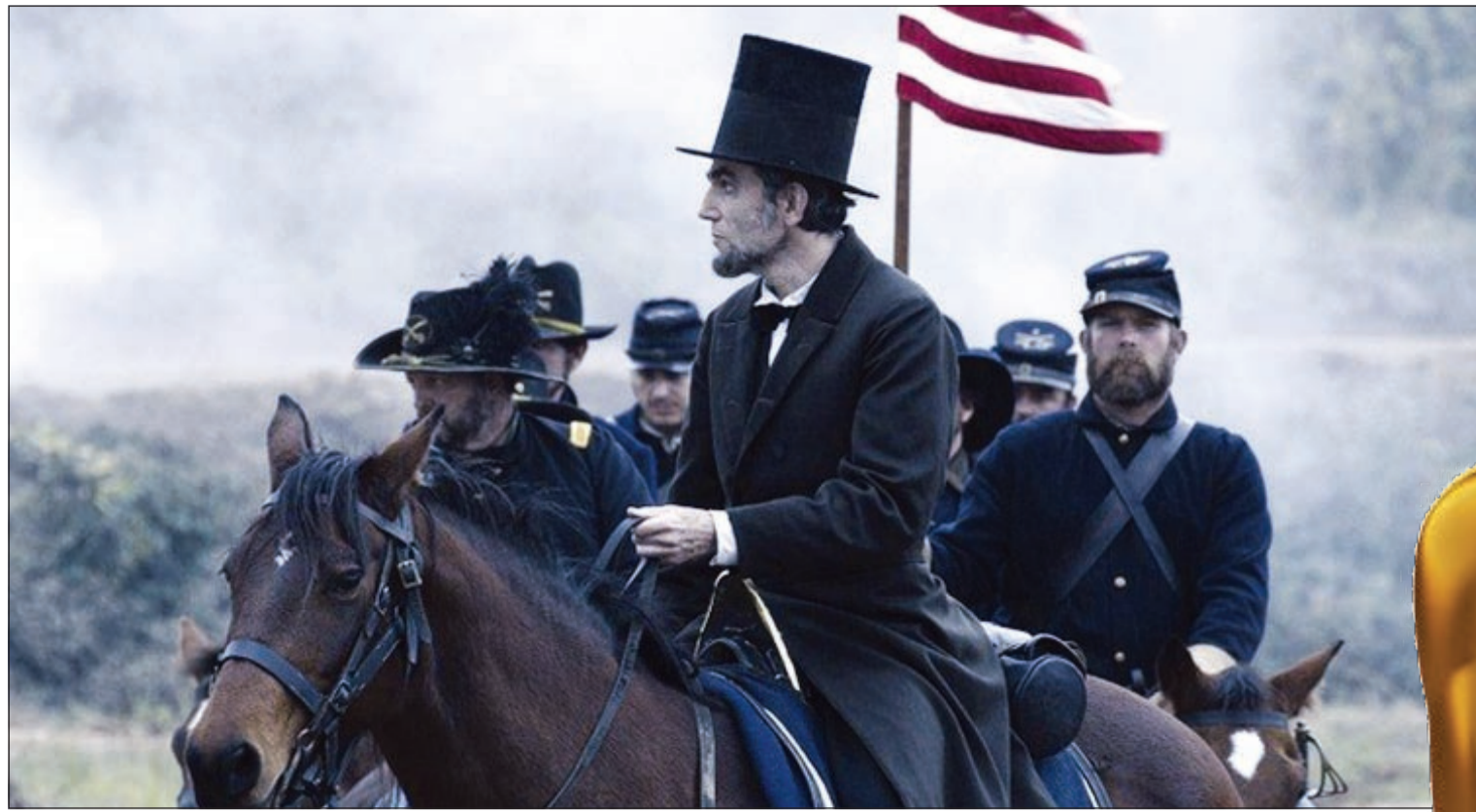
دانيال داي لوييس في «لينكولن»