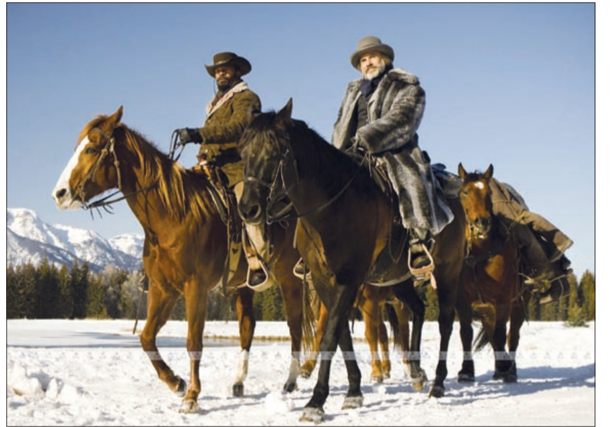
لقطة من «تحرير دجانغو»

وسوف تستمر النقاشات بين الأعضاء الـ 5856 في الأكاديمية الأمريكية لفنون السينما وعلومها التي تنظم منذ العام 1929 حفل توزيع جوائز «أوسكار» حتى مساء اليوم لتعيين الفائزين بهذه الجوائز العريقة. ويعول فيلم «لينكولن»