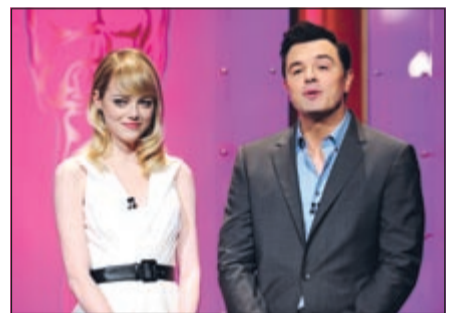
لحظة إعلان الترشيحات

المخرج الذي سيفوز: ستيفن سبيلبرغ المخرج الذي سينافس بقوة: آنغ لي من يجب أن يفوز: ستيفن سبيلبرغ