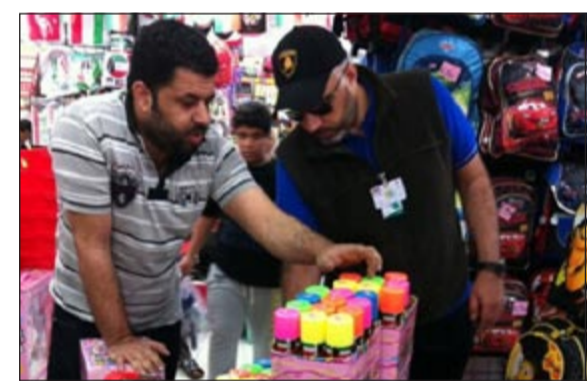
جانبا من علب الفوم المصادرة