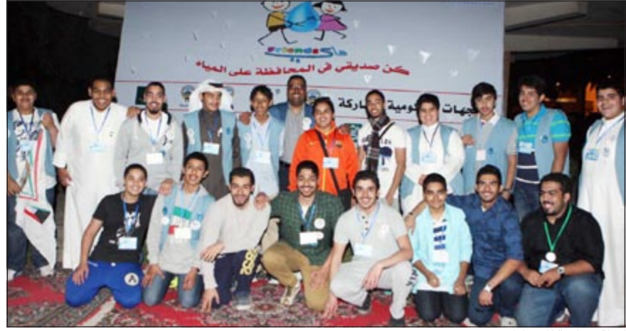
لقطة جماعية للمشاركين

بالترشيد في استخدام مياه الشرب. وبين المزيبي ان انشطة نادي «ماي فريندز» ستتواصل في الأشهر المقبلة وفق جدول زمني مدروس، لتوظيف طاقات وإمكانيات الشباب في فترات العطل والإجازات لخدمة المجتمع والتوعية بقضاياها الحيوية والمهمة خصوصاً قضية المياه العذبة الصالحة للشرب والتي لا تملك الكويت مواردها مما يجعلها ثاني أفقر دولة في العالم بمصادر المياه. واختتم د. صالح المزيبي حديثه بتوجيه عميق الشكر وجزيل الامتنان للجهات الداعمة والمشاركة في انشطة نادي أصدقاء المياه الذي أطلقته الجمعية الكويتية للمياه لطلبة مدارس وزارة التربية والتعليم للتدريب والتوعية والتأهيل في مجال ترشيد استهلاك المياه، مشيراً الى الجهات الداعمة للبرنامج والنادي وهي وزارة الإعلام ووزارة الدولة