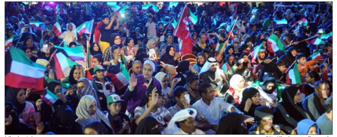
جانب من الحضور في الاحتفال