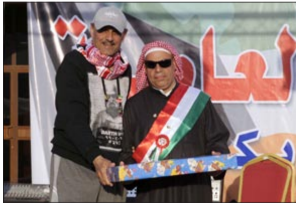
توزيع هدايا على الحضور