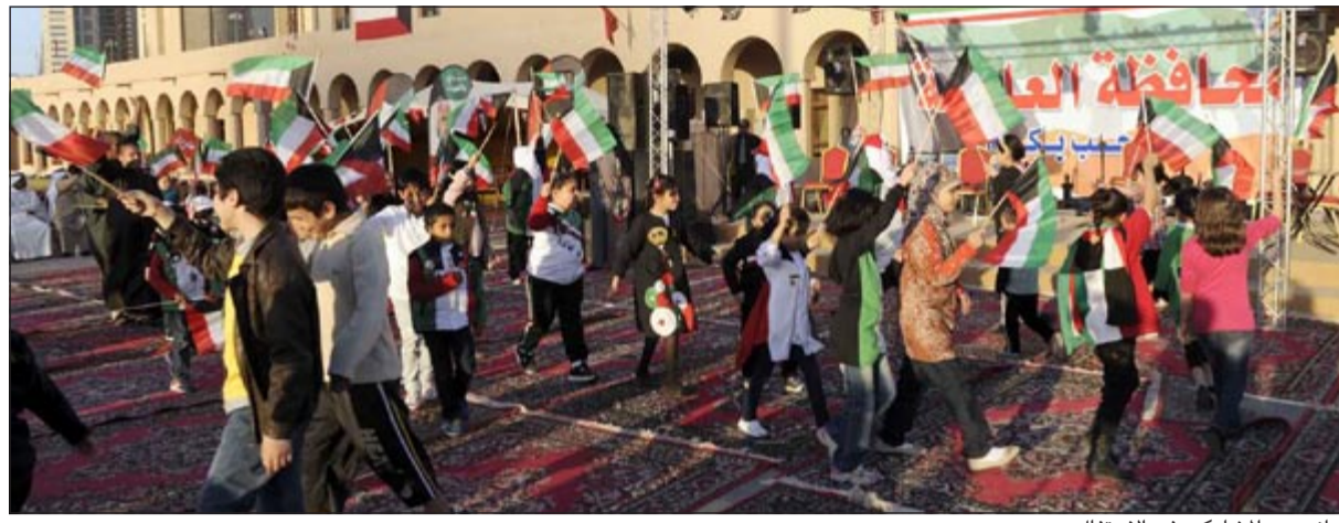
جانب من المشاركين في الاحتفال