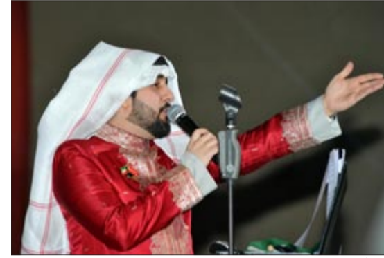
أحد أعضاء الفرقة

الحفل الغنائي استمر لمدة 4 ساعات متواصلة، حيث بدأ من الساعة الثامنة مساءً حتى الساعة 12 صباحاً.