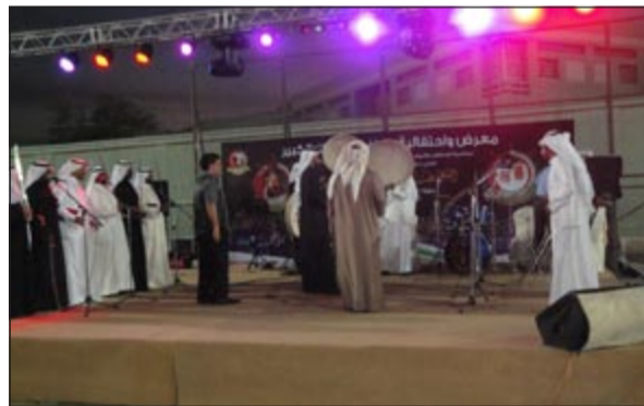
جانب من عرض الفرق التراثية