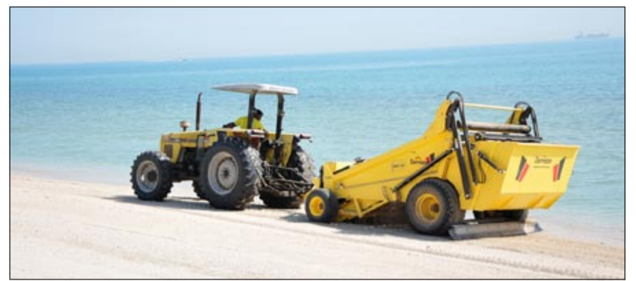
جانب من عملية تنظيف الشواطئ