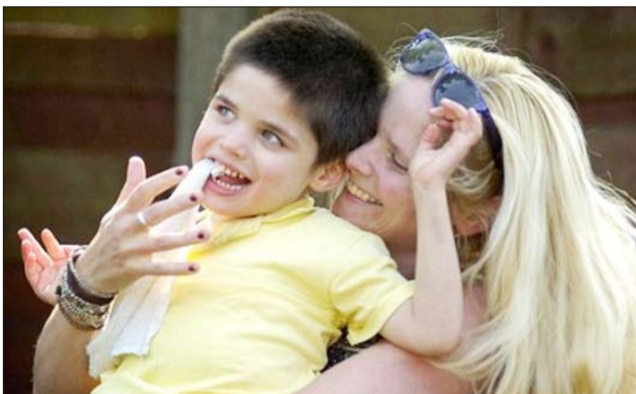
الطفل مع أمه