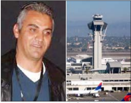
عماد برنات في مطار لوس أنجيليس

لوس أنجيليس العربية: أعرب المخرج الفلسطيني عماد برنات عن أسفه لأنه احتجز لمدة ساعة في قسم الجمارك في مطار لوس أنجيليس حيث كان متوجها للمشاركة في حفل جوائز الأوسكار، مشبها الحادث بما يتعرض له مواطنوه في الضفة الغربية. وأوضح برنات في بيان: خضعت لاستجواب لمدة ساعة مع عائلتي من قبل أجهزة الهجرة الأميركية في لوس أنجيليس حول أسباب زيارتي للولايات المتحدة. وكان عماد برنات قد اختير لفئة الفيلم الوثائقي الطويل عن فيلمه «5 كاميرات محطة» الذي يروي فيه الحياة اليومية لفلسطيني طرد من أرضه لإقامة مستوطنة يهودية عليها.