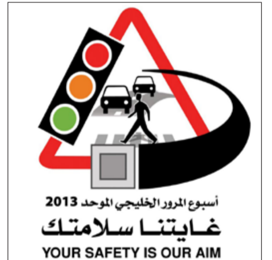
شعار أسبوع المرور الخليجي الموحد

أعلنت اللجنة المنظمة لأسبوع المرور الخليجي الموحد لدول مجلس التعاون لعام 2013 برئاسة وكيل وزارة الداخلية المساعد لشؤون المرور اللواء دمصطفى الزعابي والذي يقام تحت شعار «غابتنا سلامتك» في الكويت اعتباراً من 10 إلى 14 مارس المقبل، عن انطلاق المسابقة الثقافية التوعوية لهذا الأسبوع، حيث تهدف هذه المسابقة إلى تحفيز المشاركين فيها على البحث والتعرف على بعض المفاهيم المتعلقة بالعمل المروري والقوانين المنظمة له.