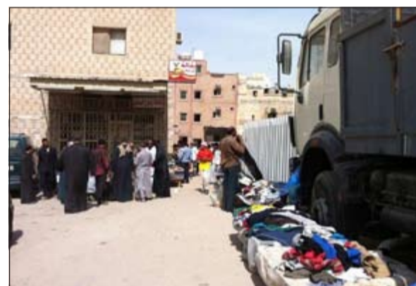
مصادرة البضاعة المضبوطة في الاسواق العشوائية قبل نقلها

شن رجال امن الفروانية حملة كبيرة ظهر امس على منطقة الجليب وتم ضبط نحو 90 وافتد ووافدة مخالفين لقانون الإقامة بالإضافة إلى عدد من الباعة المتجولين.