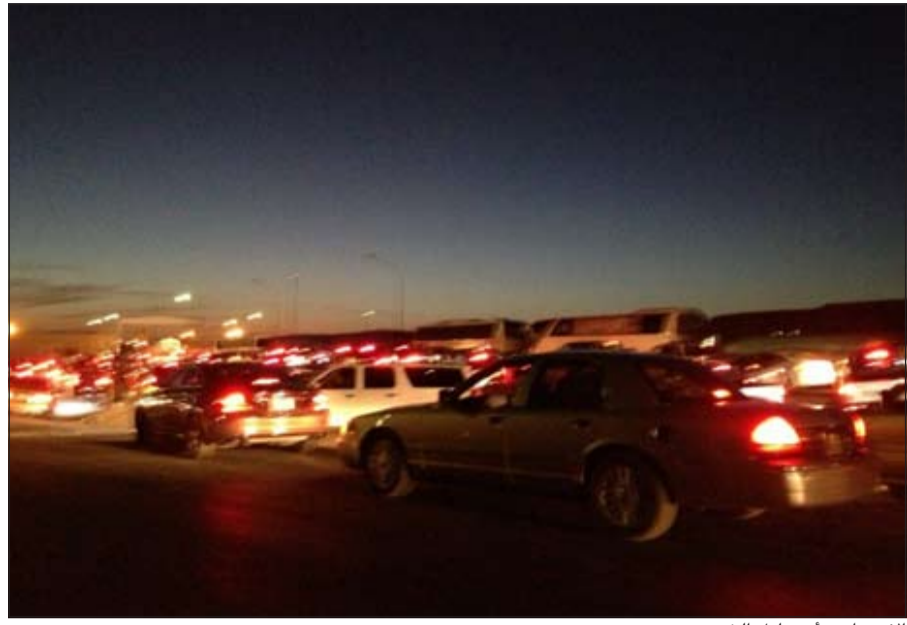
الازدحام بدأ من ليل الخميس