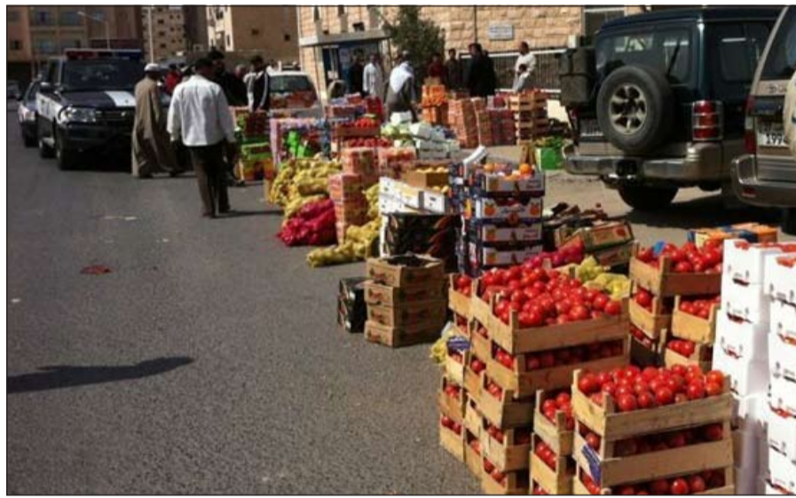
دوريات اغلقت السوق العشوائية في جليل الشيوخ قبل ضبط المخالفين

سيارته عثر بداخلها على عدد من الخمور المستوردة اعترف بأنه يحوزها بقصد الاتجار وعليه أحيل إلى جهات الاختصاص.