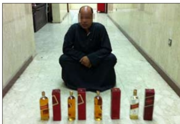
المتهم بالاتجار بالخمور وأمامه الكمية المضبوطة

للاختصاص، هذا وقبل انتهاء الحملة بقليل اشتبه رجال الأمن في سيارة يقودها وافتد مصري يحاول الهرب من نقاط التفتيش التي أقامت على مدارح ومآراج المنطقة وتم استيقافه وبتفتيش