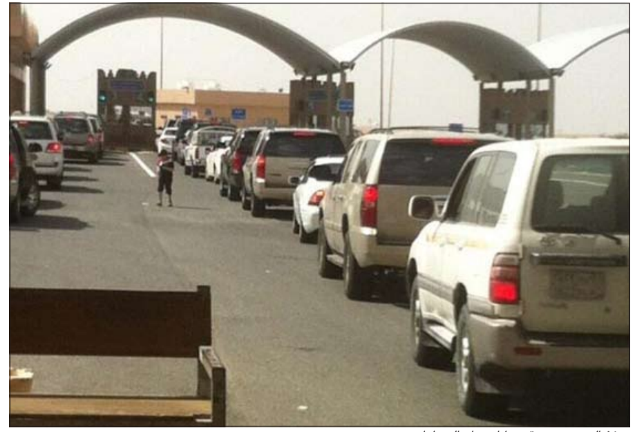
منفذ النويصيب وقد بدأ ازدحام السيارات

الأول الخميس بلغ 22504 الذي دخلوا عبر المنفذ للمغادرة و7157 للدخول، كما بلغ عدد الذين غادروا عبر منفذ النويصيب 20362 بينما بلغ عدد المسافرين