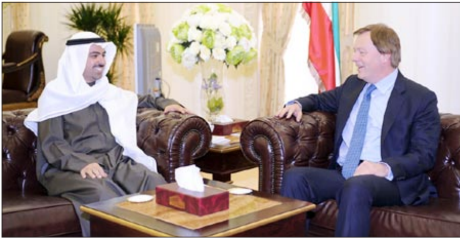
..مستقبلاً السفير البريطاني

واستقبل الراشد سفير جمهورية روسيا الاتحادية لدى الكويت اليكساندر كينشاك جرى خلال المقابلة بحث العلاقات الثنائية بين البلدين الصديقين وسبل تعزيزها. كما استقبل الراشد سفير جمهورية باكستان الصديقة لدى الكويت فهميدا ميرزا، حيث تبادل الطرفان الأوضاع الجارية على الصعيدين الإقليمي والدولي، حضر ألقابته عضو مجلس الأمة أحمد المليفي. في السياق نفسه، استقبل الراشد سفير المملكة المتحدة لدى الكويت فرانك بيكر، وجرى خلال المقابلة التطرق إلى العديد من الموضوعات التي تربط بين البلدين الصديقين والعلاقات الطيبة والمميزة بينهما في شتى المجالات.