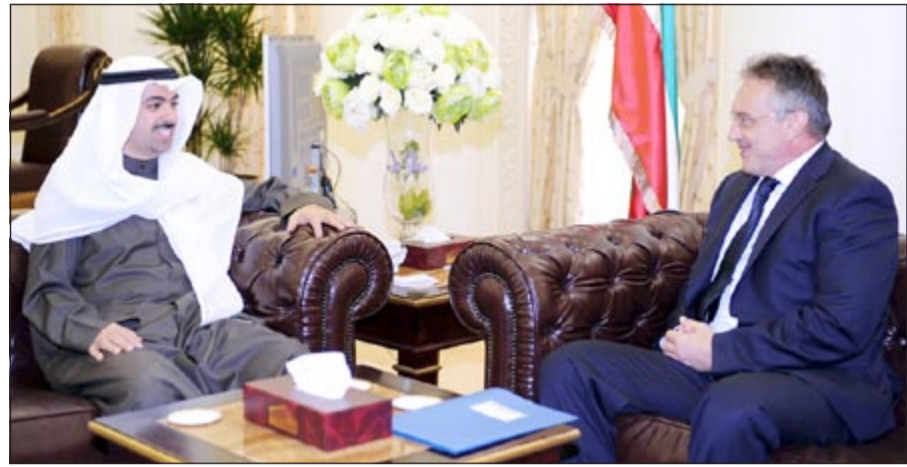
الرئيس علي الراشد خلال استقباله السفير الروسي

بعث رئيس مجلس الأمة على الراشد ببرقية تهنئة لصاحب السمو الأمير الشيخ صباح الأحمد وذلك بمناسبة العيد الوطني وعيد التحرير. وقال الراشد في برقيته: في أوج فرحة الكويت وأبنائها الأوفياء، يتعاقب عيدان متتاليان سطع سنا ضيائهما إشراقاً على أرضنا الطاهرة الطيبة، وفي غمرة موكب هذا العرس المنبجج والفرحة العارمة التي تتجدد كل عام بمناسبة العيد الوطني وعيد التحرير الذي تزامن معهما اعتلاء سموك سدة حكم البلاد في عامه السابع المجيد، يسرني أن أرفع لسموكم باسمي ونيابة عن إخواني أعضاء السلطة التشريعية بمجلس الأمة بكل محبة وإجلال وإكبار وولاء إلى مقام سموكم الكريم من أعماق الوجدان أصدق التهاني القلبية التي تتخلل بها صدورنا ويرددها شعبيكم الوفي الذي تنسم العزيزة على قلوب أهل الكويت، ومحقق لأمانه وتطلعاته، مع أسعد التمنيات بهذه المناسبة، رافعين أكف الضراعة إلى المولى جل جلاله أن يعيد أمثال هذه المناسبة المميّزة على سموكم وأنتم رافلون في حلل من العز متمتعون بموقور الصحة