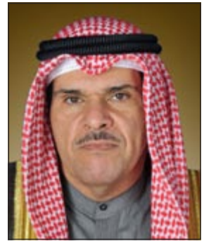
الشيخ سلمان الحمود

بيروت - كونا: قال وزير الإعلام الشيخ سلمان الحمود في مقابلة صحافية أن «هدفنا تطوير الإعلام وتحويله إلى نهج مبادر والارتقاء بثقافة الإعلام لتكون على مستوى سياسيات الدولة». وأضاف الشيخ سلمان في مقابلة مع «مجلة الصياد» اللبنانية في عددها الذي سيصدر اليوم أن الدستور هو سيد الأحكام وضمانة الكويت الحقيقية «وأن القانون يجب أن يطبق على الجميع». ولفت الشيخ سلمان إلى أن الكويت صاحبة أول تجربة حقيقية في الديمقراطية نصوصا وممارسة، مشددا على