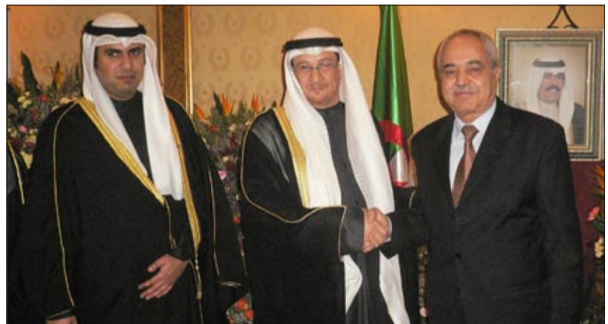
السفير سعود الدويش مستقبلا أحد المهتمين

أقامت سفارتنا لدى دولة قطر حفلا بمناسبة العيد الوطني الـ 52 والذكري الـ 22 للتحرير. وأعرب المشاركون لسفيرنا لسدي قطر على الهيفي عن تهنيتهم للكويت بقيادة وحكومة وشعبا بهذه المناسبة الوطنية التي تجسد مسيرة حافلة بالإنجازات على كل الاصعدة السياسية والاقتصادية والاجتماعية والثقافية وغيرها والتي دفعنا بالكويت لأن نتبوأ مراكز متقدمة وان يكون لها دور مؤثرة على المستويين الاقليمي والدولي.