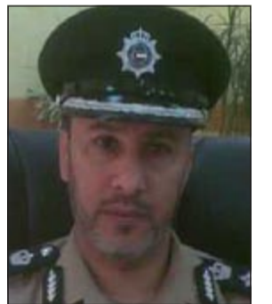
العقيد صالح الدعاس

وفي التفاصيل التي يرويها مصدر أمني، فإن تعليمات من مدير أمن الجهراء اللواء إبراهيم الطراح بضرورة توقيف وضبط المخالفين في منطقة الواحة لتأتي تعليمات قائد المنطقة العقيد صالح الدعاس لرجاله