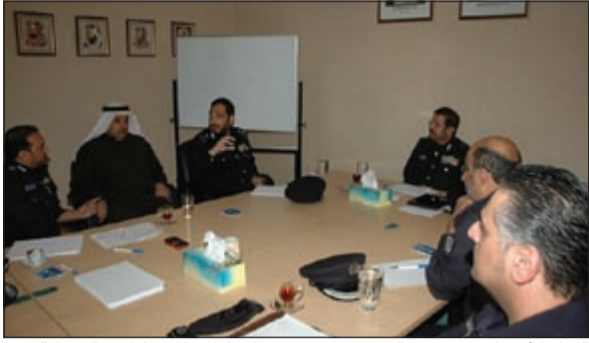
اللواء الأنصاري يستمع إلى شرح من مسؤولي إدارة الإنشاءات والصيانة

قام مدير عام الإدارة العامة للإطفاء اللواء يوسف عبدالله الأنصاري بجولة تفقدية صباح أمس اشتملت على إدارة الإنشاءات والصيانة بأقسامها المختلفة. ومن خلال الزيارة التفقدية تم تبادل الأحاديث الودية بين القياديين ومتمسسي هذه الإدارة والاستماع إلى اقتراحاتهم للنظر فيها والسعي لحلها، وحثهم على المزيد من العطاء للوصول إلى ما ترمي إليه الإدارة وهو الحفاظ على الأرواح والممتلكات وبدأ اللواء الأنصاري حديثه عن الإستراتيجية التي تتبعها الإدارة لتطوير الآليات، وإضافة آخر ما توصلت له سبل التطور وتلبية احتياجات المراكز وتطوير المنشآت ما يساعد على