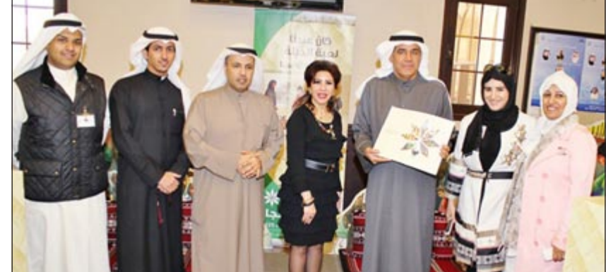
جانب من مشاركة «التجاري» في احتفالات كلية الحقوق بالأعياد الوطنية