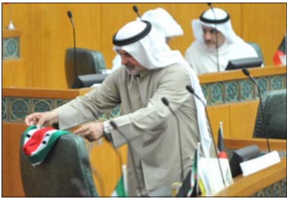
ويضعه على الكرسي