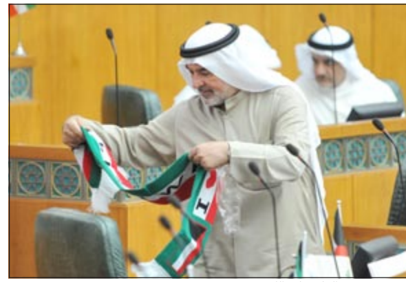
ويهم بوضع العلم على الكرسي