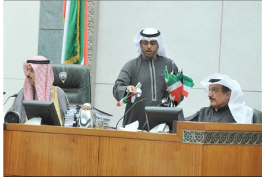
الرئيس علي الراشد وأمين السر كامل العوضي على المنصة أثناء توزيع علم الكويت على القاعة