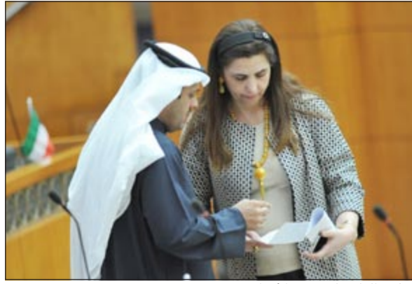
..ثم يطلغان على بعض الأوراق