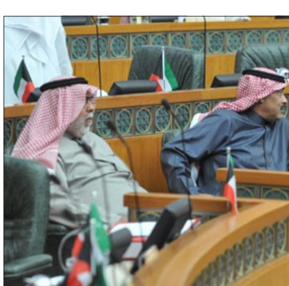
خلف نديمير والشيخ صباح الخالد خلال الجلسة والشيخ أحمد الخالد

الجنة): صندوق المشاريع البسيطة لم يأت لإنهاء مشكلة البطالة فقط، ونحن نتحرك لبناء اقتصاد حقيقي. ● خليل عبدالله: أصل المشكلة كانت عندما توجه الشباب للبنوك كانوا لا يعطون الشباب القروض بسبب عدم وجود ضمانات، وأنا أستغرب عدم تحديد حد أعلى للفترة العمرية، وهذا القانون لا يترك نسبة محددة لعمل الكويتيين في أي مشروع ينتج عن دعمه، ويجب ألا نعرقل المشاريع من باب استكمالها، من يضمن بهذا