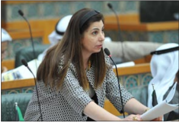
..وتتحدث خلال الجلسة