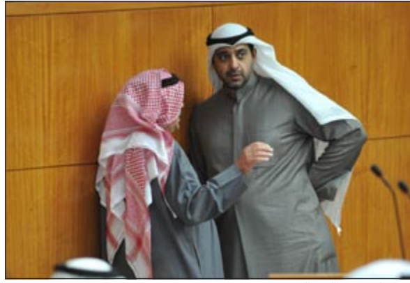
..ويتناقش مع الشمالي