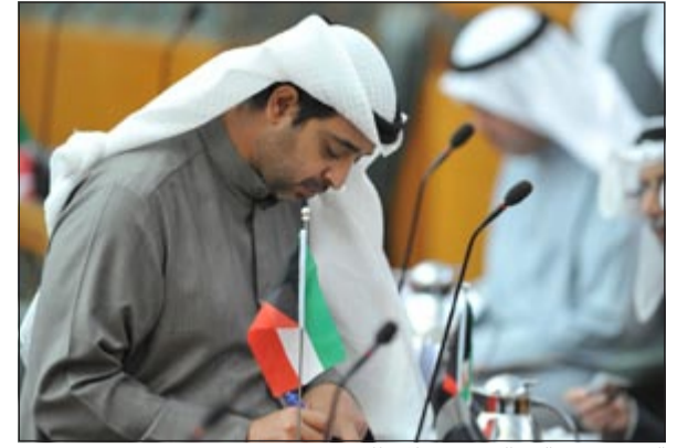
الشيخ محمد العبدالله بدون ملاحظاته