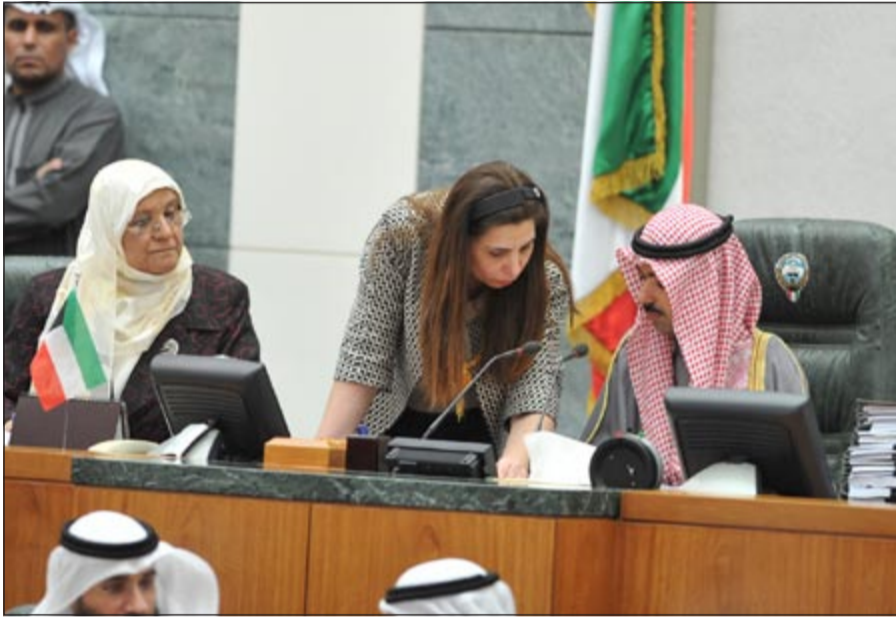
الرئيس علي الراشد ويجانبه درولا دشتي ودمعصومة المبارك (متن غوزال)