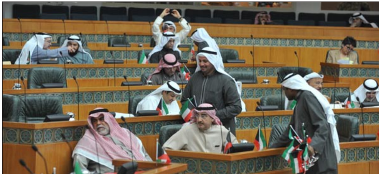
توزيع اعلام الكويت على مكاتب النواب احتفاء بالاعياد الوطنية