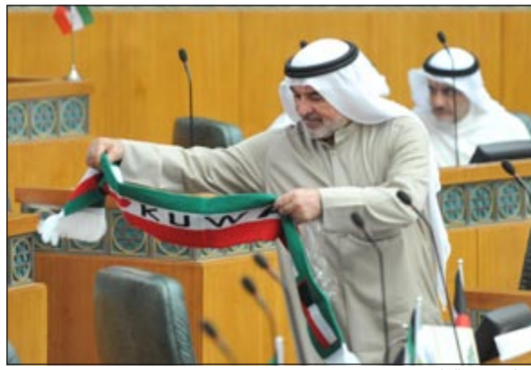
ثم يرفق العلم