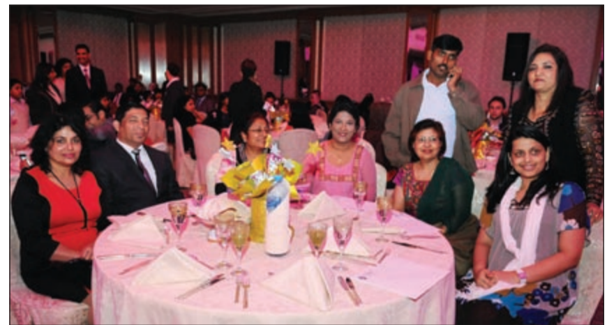
متابعة من الحضور

فوربوينتس شيراتون الكويت مازن المهنا بشرح موجز عن برنامج «ستارتشويس»، مبينا خصائصه وفوائده. كما تخلل الحفل