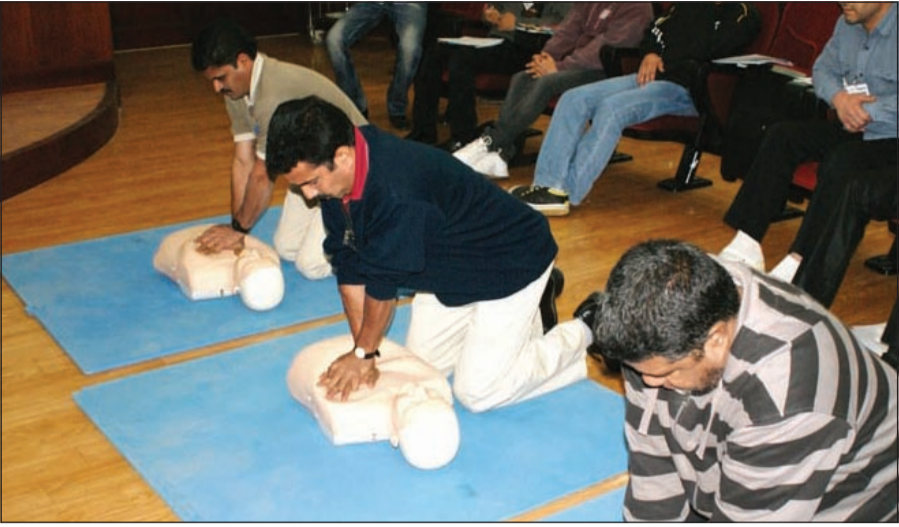
جانب من دورة الإسعافات الأولية في «كوستا ديل سول»