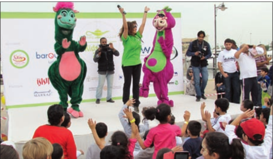
فقرة ترفيهية بمشاركة الشخصيات المحببة للأطفال