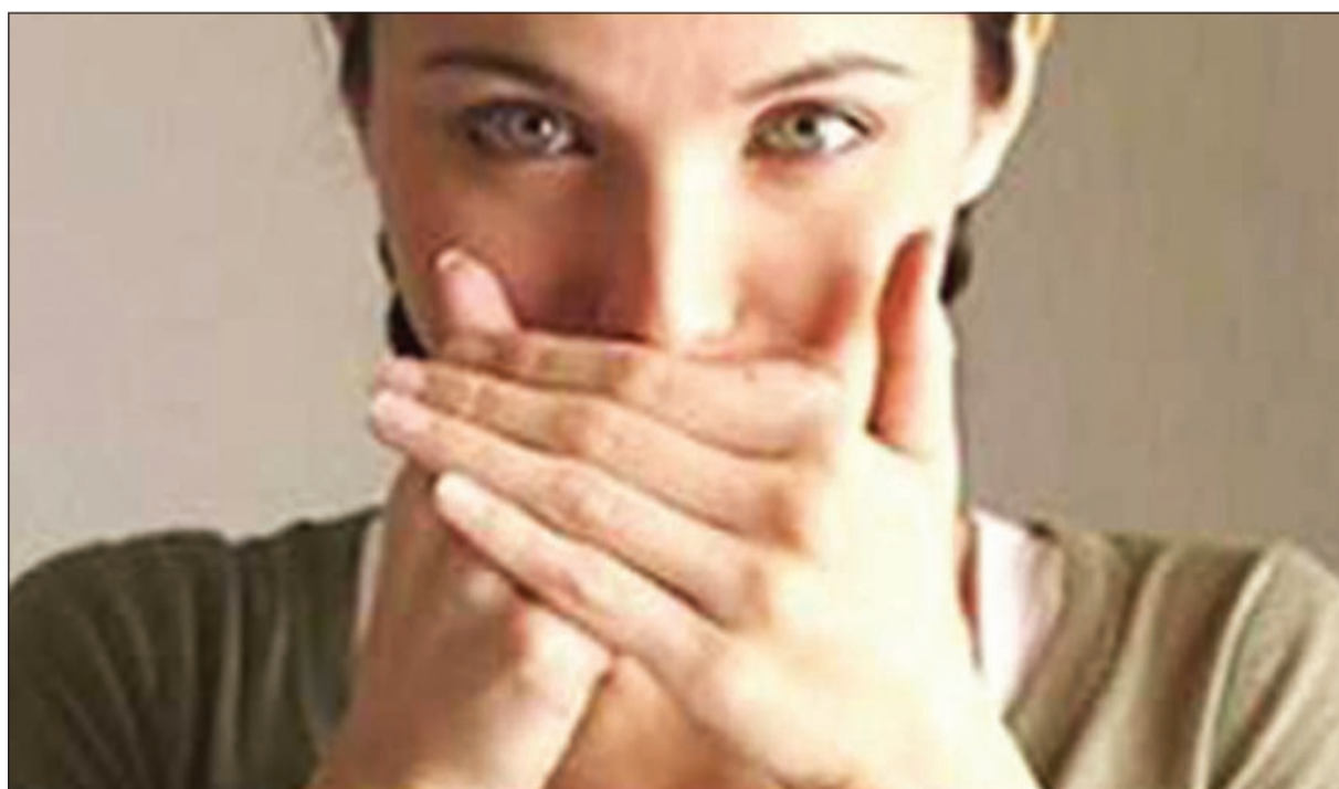
يجب السير على نظام صحي بعد عملية تحويل المسار أو التكيم

القديمة في الاكل ربما ترتب على ذلك مضاعفات منها انتقاب المعدة، واعادة تمدد المعدة مرة اخرى يذهب التعب والجراحة والمصاريف سدى وبالتالي يحتاج الى اعادة تأهيل، بوجود طبيب امراض نفسية او طبيبى امراض نفسية بالإضافة الى طبيب اخصائي أو طبيبة اخصائية تغذية لأن الجراح لا يستطيع الاهتمام بكل الامور وإعادة التأهيل بنفسه شخصياً فاهتمامه بأمور اخرى وحالات اخرى، أما مرضى البدانة فيحتاجون الى اعادة تأهيل بواسطة طبيب نفسي وبواسطة اخصائية تغذية كما رأينا هذا في إيطاليا