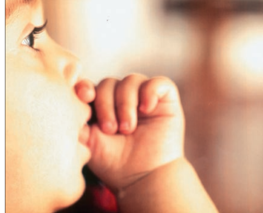
يجب إصلاح الفتق الإربي عند الطفل حتى لو كان عمره شهرين

الالتهاب المراري حتى غير الحصوي أيضاً خطر جداً، لأنه كحالة مرضية مزمنة يمكن أن يرتبط بحدوث أورام بالحويصلة المرارية، وهي شديدة الالتصاق بالكبد، وهنا ممكن الخطورة، حيث تؤدي إلى أورام خبيثة في الكبد في فترة وجيزة. من كل ما تقدم وحيث أن علاج المرارة سهل وميسور وعن طريق عملية منظار البطن تستغرق ما بين 35 إلى 45 دقيقة فقط ولا تتطلب البقاء بالمستشفى لأكثر من يوم واحد، يجب تفادي هذه المخاطر، لذلك أنصح بعدم التأخر في العلاج بالاستئصال مهما كانت الظروف.