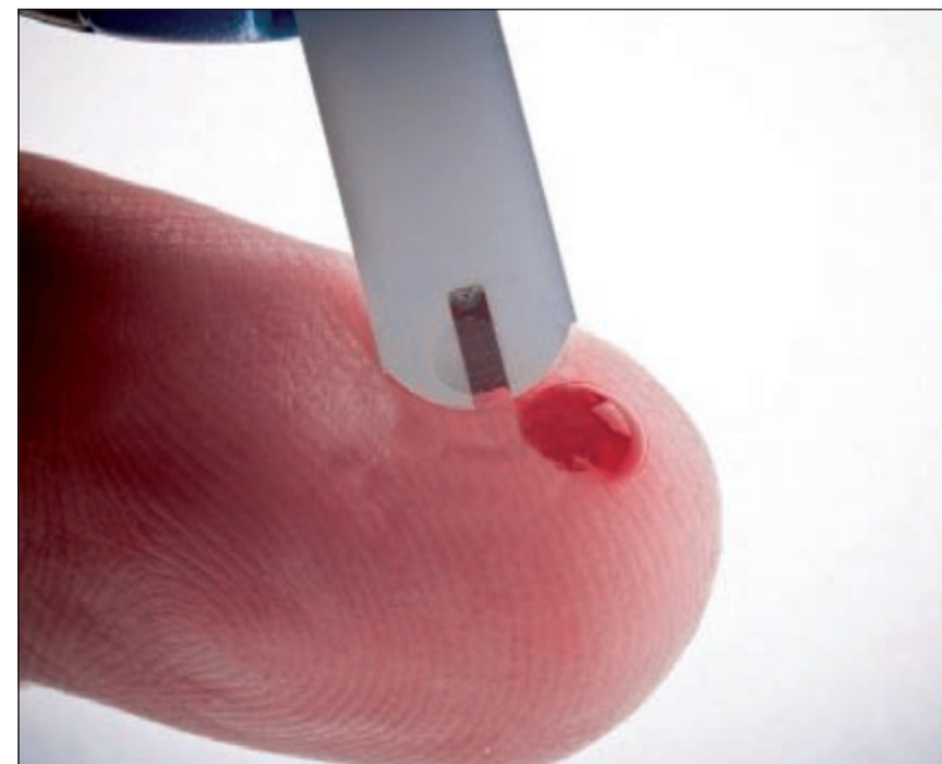
أكثر المستفيدين من عمليات السمنة هم مرضى السكري