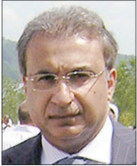
السفير محمد خلف

سراييفو - كونا: بحث سفيرنا لدى البوسنة والهرسك محمد فاضل خلف مع مستشار الشؤون الأمنية لحزب العمل الديمقراطي باكر علي صباحيتش امس المستجدات التي تشهدها البلاد لاسيما فيما يتعلق بتشكيل الحكومة الفيدرالية الجديدة التي يتوقع ان تؤدي الى خلافات سياسية جديد داخل الفيدرالية البوسنية.