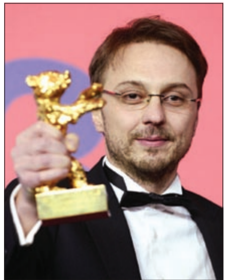
كالين بيتر يحمل جائزة

برلين - د.ب.أ: فاز فيلم المخرج الروماني كالين بيتر «نيتزر» «تسايلدن بوز» أو «وضع طفل»، والذي تدور قصته عن أم تحسول الإبقاء على ابنها خارج السجن عن طريق رشوة مسؤولين وأحد الشهود، بالجائزة الكبرى لأفضل فيلم في مهرجان برلين السينمائي. لكن نيتزر قال في مؤتمر صحافي إن فيلمه لا يمثل استقراراً لرومانيا الحديثة. وقال: «أولا وقبل أي شيء هذا الفيلم يصور علاقة بين أم وابنها». وتابع «الباقى مجرد خلفية، بالطبع إننا نشير إلى الواقع في رومانيا اليوم، ولكن الفساد ليس بالشيء الذي يحدث في رومانيا فقط». وعلى الرغم من هذا انتقدت منتجة الفيلم أدا سولومون التحركات الجارية في رومانيا لتقليص الأموال التي تخصصها الدولة لصناعة الأفلام. وأبرز مهرجان هذا العام الطفرة التي تحدثت في أوروبا الشرقية وذلك في ظل فوز المخرج اليوسني تانوفيتش بجائزة لجنة التحكيم الكبرى (وهي الجائزة الثانية - الدب الفضي) عن فيلمه «حلقة في حياة جامع الحديد». ويحكي الفيلم قصة أسرة من عجر الروما تواجه الفقر والتمييز في أوروبا في العصر الحديث.