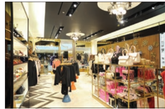
تصميم خاص لـ Ted Baker

تعم أنشطة الأفلام المعلقة جميع أرجاء المحل وقد استكمل هذا التصميم عبر إضافة لوحة ضوئية مربعة الشكل تزينها الزخرفات الخاصة بأسرطة الأفلام،