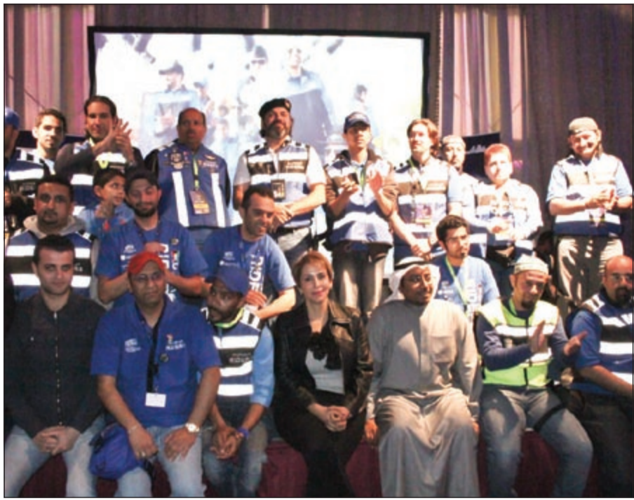
فريق كويت رايدرز