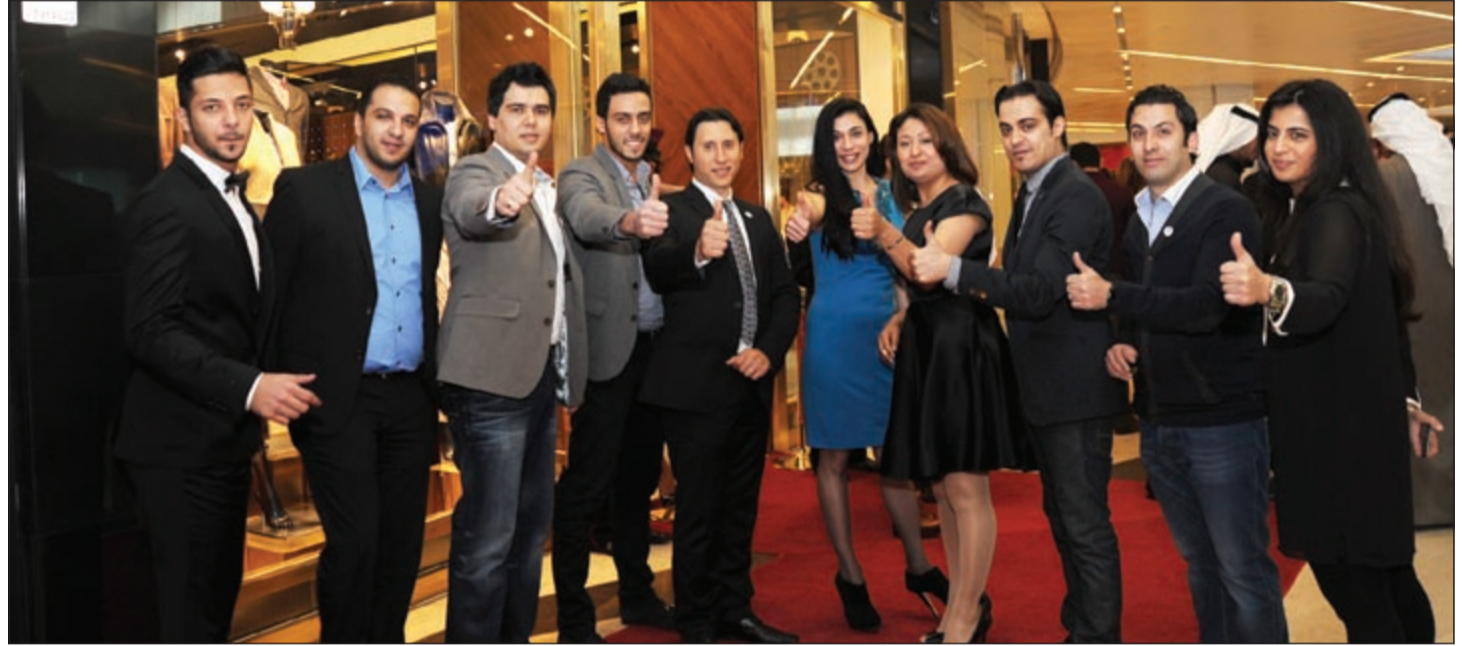
فريق العمل في لحظة تذكارية

أضواء المسرح في أرجاء المكان بشكل ممتان كما تبرز ستارة مسرح خلفية لعرض مجموعات ربيع وصيف 2013 من ماركة Ted Baker التجارية، باختصار انها مجموعة ثياب للرجال والنساء والإكسسوارات الأكثر أناقة المصممة بسهولة فائقة وعلى نحو ناجح، ودائما على حد قول Ted Baker، ان النقطة بالنفس عبارة عن حالة مزاجية وعن ربطة عنق مستقيمة بعقدة ويندوسور لرجال الأعمال.