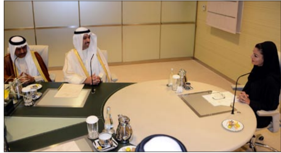
رئيس مجلس الأمة علي الراشد يستمع لشرح الشقيقة موزة حول مؤسسة قطر للتربية والتعليم

استقبل ولي عهد قطر سمو الشيخ تميم بن حمد آل ثاني رئيس مجلس الأمة علي الراشد والوفد المرافق له، وجرى خلال اللقاء بحث العلاقات الثنائية بين البلدين الشقيقين وسبل تعزيزها ومناقشة آخر المستجدات على الساحتين الإقليمية والدولية، وحضر اللقاء الأعضاء: أحمد لاري، حمد سيف الهرشاني، د.صلاح العتيقي، محمد البراك، ناصر الشمري والأمين العام لمجلس الأمة علام الكندري وسفيرنا لدى قطر الشقيقة علي سلمان الهيفي ورئيس مجلس الشورى القطري مبارك الخليفي.