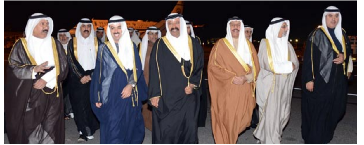
الخليفي مستقبلاً وفد مجلس الأمة برئاسة الراشد