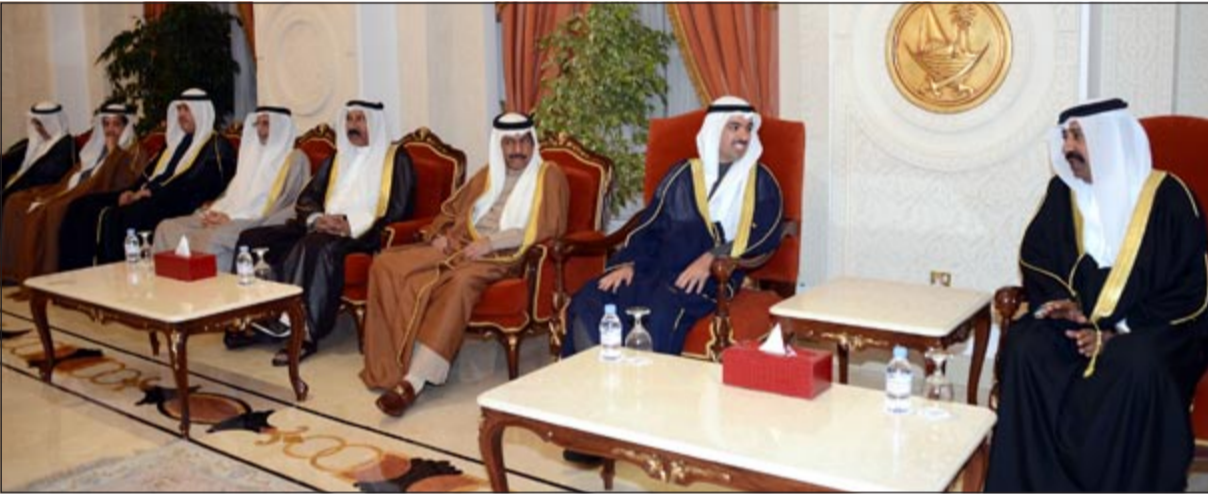
رئيس مجلس الشورى القطري مبارك الخليفي ورئيس مجلس الأمة علي الراشد والوفد المرافق له

الشمري: العلاقات الكويتية - القطرية مثال يحتذى