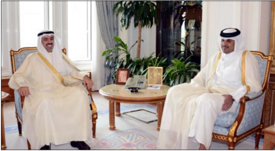
سمو ولي عهد قطر الشيخ تميم بن حمد آل ثاني مستقبلاً الراشد

جميعاً. من جهته، قال النائب ناصر الشمري إن العلاقات الكويتية - القطرية مثال يحتذى به للعلاقات الخليجية، مشيداً بسعي القيادة القطرية إلى وحدة الصف الخليجي وبذل الجهود الدبلوماسية إلى مزيد من التعاون فيما بين دول مجلس التعاون لصالح الشعوب الخليجية. وأضاف الشمري أن البرلمان الخليجي يسعون إلى تحقيق طموحات وآمال الشعوب الخليجية التي تريد الاستقرار والتقدم لأبناء الخليج بما يحقق الفائدة اقتصادياً واجتماعياً على الجميع.