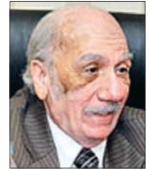
الكاتب محفوظ عبدالرحمن

صرح منسق عام لجنة الطفل في المجلس الوطني للثقافة والفنون والآداب د.حسين المسلم بأن الكاتب العربي الكبير محفوظ عبدالرحمن سيكون احد أبرز ضيوف الدورة الأولى للمهرجان العربي لمسرح الطفل الذي ينظمه المجلس الوطني للثقافة والفنون والآداب في الفترة من 19.7 مارس المقبل. وأشار المسلم إلى ان مديرة