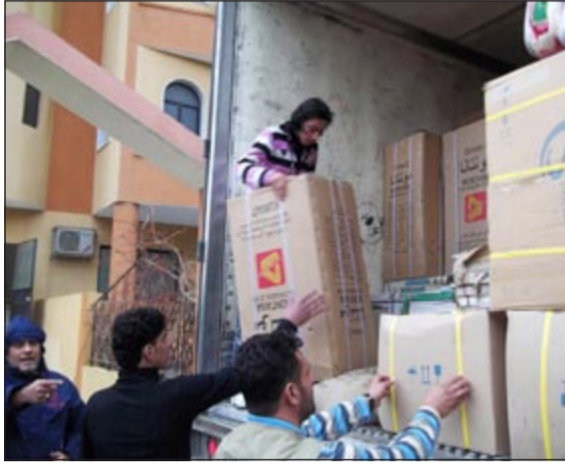
جانب من توزيع المساعدات الكويتية

وأعرب عن شكره العميق للكويت اميرا وحكومة وشعبا ومؤسسات وجمعيات خيرية على هذا الدعم الذي يقدمونه