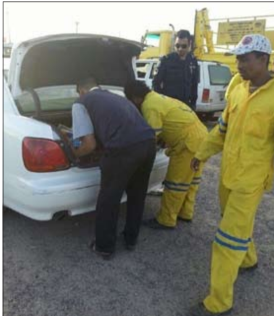
السيارات الخاصة تنقل الأغذية والبضائع التالفة إلى البقالات المنتجة