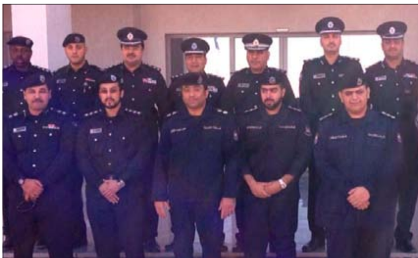
اللواء خالد الدين متوسط الضباط المرقيين في المؤسسات الإصلاحية