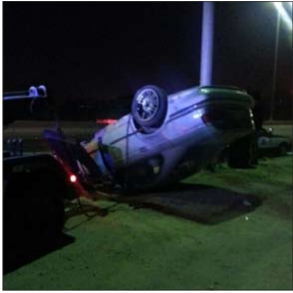
صورة لحادث مؤسف وقع أمس