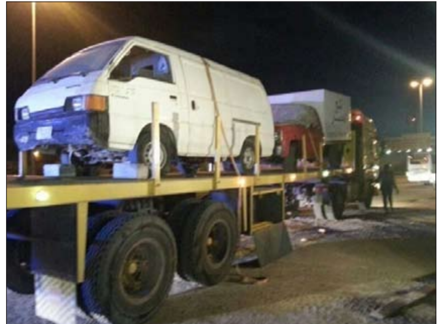
حملة الجهراء أحالت العديد من المركبات المخالفة إلى كراج الحجز

قاموا بمصادرة البضائع المضبوطة وتسليمها إلى بلدية الكويت لعمل محاضر سريعة وعرضهم بضائع التي تستعمل كبقالات دون ترخيص.