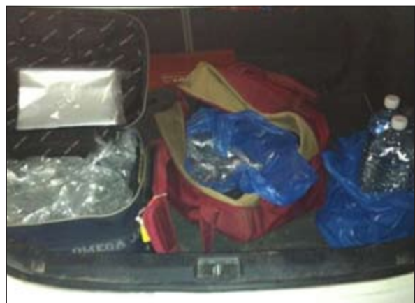
الخمر بعد ضبطها في مركبة الآسيويين