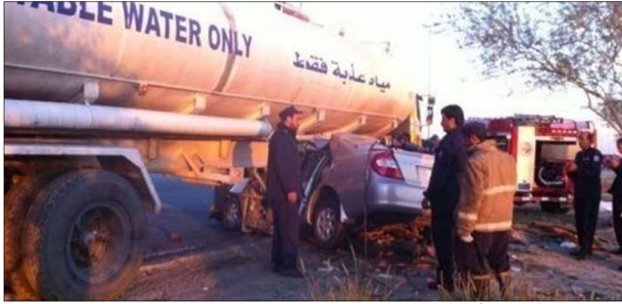
مركبة المجني عليهم الأربعة استقرت أسفل تنكر المياه