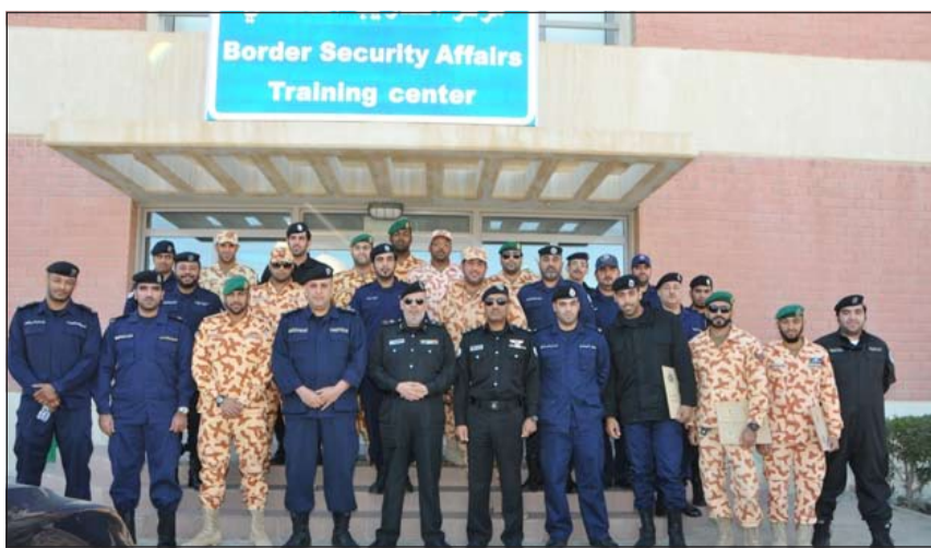
الشاركون في دورة خفر السواحل

عملية لقيادة الزوارق السريعة والمنسورة البحرية ومواد تخصصية بحرية. وختاماً للدورة قام اللواء عبداللله القناعي بتوزيع شهادات اجتياز الدورة على عقيد بحري عبدالكريم الكرم وضباط التدريب في قطاع أمن الحدود، اختتمت صباح اول من أمس أنشطة دورة قادة الزوارق السريعة التي عقدت بمرکز التدريب التخصصي في قطاع أمن الحدود خلال الفترة من 2012/11/11 حتى 14 الجاري، والمدرجة ضمن الخطة التدريبية لوزارة الداخلية، وذلك بالتنسيق مع الإدارة العامة للتدريب. وكان اللواء عبداللله القناعي قد ألقى كلمة حث فيها الخريجين على استمرار بذل الجهد للحصول العلمي والارتقاء بمستوى الأداء لخدمة وطنهم. وشارك في الدورة 19 متدرجا من منتسبي خفر السواحل لقطر الشقيقة، ولواء المغاوير بوزارة الدفاع في الكويت، والإدارة العامة لخفر السواحل. كما تضمنت الدورة