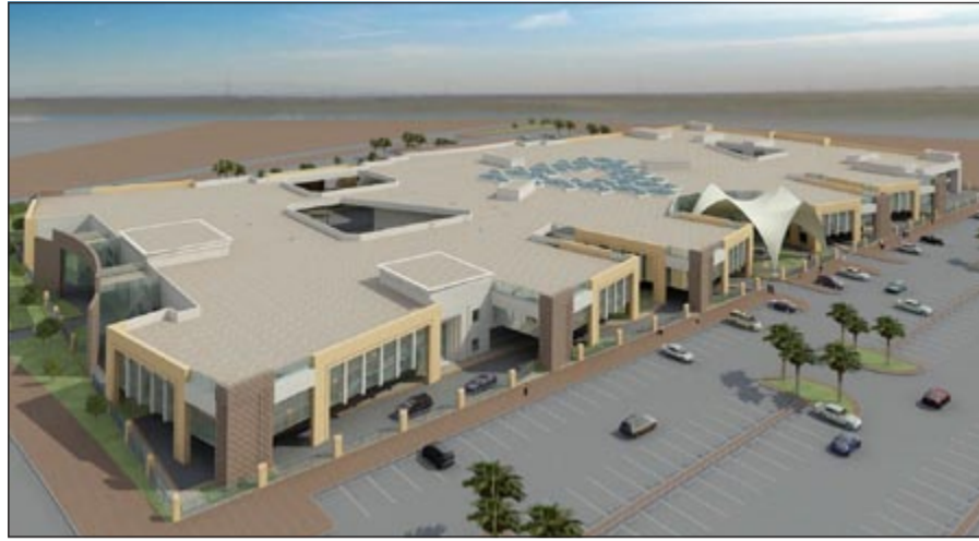
مخطط توضيحي لمبنى الهجرة الجاري إنشاؤه