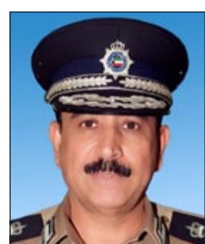
اللواء عبدالله المهنا

دعا وكيل وزارة الداخلية المساعد لشؤون العمليات اللواء عبدالله يوسف المهنا جموع المواطنين الى ضرورة التعاون مع رجال الامن كل في موقعه من أجل الصالح العام. وذلك خلال مشاركته في الاحتفالات الوطنية لإظهار الصورة الإيجابية عن الكويت وما تتمتع به من أمن وأمان. مشيراً إلى أن وزارة الداخلية قامت بوضع خطة أمنية متكاملة لمواكبة الاحتفالات متمثلة بالعديد من الإجراءات الوقائية والاحترازية لحفظ الأمن والنظام العام وإنسيابية الحركة المرورية خلال الاحتفالات.