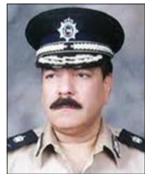
اللواء عبدالفتاح العلي