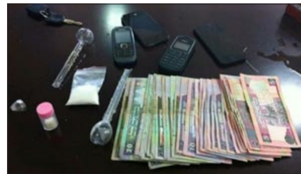
المخدرات والأموال المضبوطة بحوزة المتهم

دورية تابعة لامن الفروانية وخلال جولة لها لتفقد الأوضاع الأمنية والحد من جرائم سلب