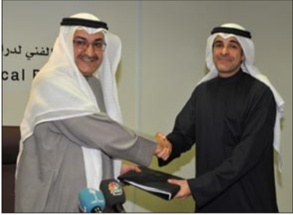
تبادل تسخني العقد