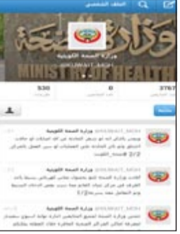
إفادة الوزارة حول الحريق