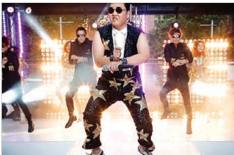
«جانجنام ستايل» أفضل وسيلة لتشجيع الأطفال على تنظيف أسنانهم

بشكل صحيح كما أنها تمكنهم من استكمال العدد الصحيح من الوقفات اللازمة لتنظيف كامل للأسنان. واشار ايفور وليامز الخبير الموسيقى إلى أن الأغاني التي تعتمد على ثمانية مقاطع موسيقية تليها مجموعتان أخريان تتكونان من أربعة مقاطع أخرى هي الأفضل في تشجيع الأطفال على استخدام فرشاة الاسنان بشكل صحيح، ووفقاً لتلك المعادلة الموسيقية استعرض وليامز قائمة من الأغاني التي تتطابق مقاطعها مع المعادلة بهدف مساعدة الأطفال على تنظيف أسنانهم بشكل أفضل.