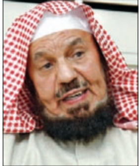
الشيخ عبدالله المنيع

الرياض - العربية: أكد عضو هيئة كبار العلماء الشيخ عبدالله المنيع ان المتجمهرين حول الحوادث لاستطلاع الحدث «أثمون» لما يسببونه من اعاقه للحركة المرورية وتأخير وصول الخدمة الإسعافية للمصابين. وأضاف ان عليهم يعد اجراماً وسبياً من اسباب مضاعفة الحوادث التي تلحق الضرر بالمصاب وهو من التعاون على الإثم والعدوان، وقال حسب صحيفة «الرياض» ان التجمهر يعد ظاهرة غير حضارية وسبياً لتفاقم حالة المصابين واربك المسعفين والمارة وتعطيل مصالح المسلمين.