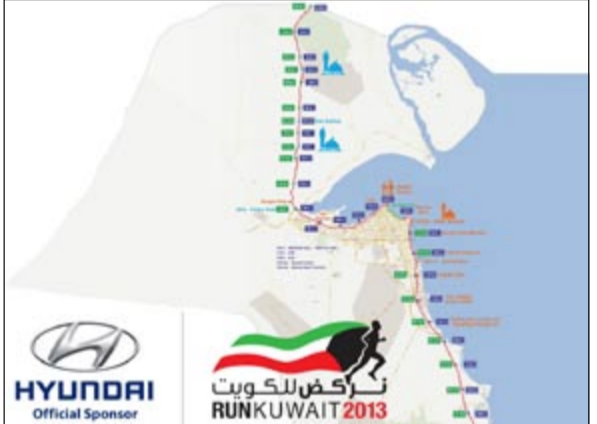
مسار رحلة هيونداي «نركض للكويت 2013»

أعلن مشروع «آيم سترونج» المنظم لرحلة «هيونداي» نركض للكويت 2013، عن خريطة الرحلة والتي ستنتقل بتاريخ 23 الجاري من الحدود الشمالية للبلاد وصولاً إلى الحدود الجنوبية يوم 27 بمسافة قدرها 240 كيلومترا بمعدل 50 كيلومترا يوميا. وأوضح البيان الصادر من منظمي الرحلة بأن الانطلاقة اليومية ستكون في تمام الساعة 8 صباحا والمبيت في أماكن محددة ومجهزة مسبقا حيث لا يمكن لأفراد الفريق العداء أن يعودوا لمنازلهم حتى انتهاء الرحلة والتي سيبدأونها من الحدود الشمالية في اليوم الأول متجهين جنوبا 50 كيلومترا، وفي اليوم الثاني 24 فبراير سيصلون إلى شارع الجواهر وصولاً إلى صالة الشهيد فهد الأحمد وهي نقطة الوقوف، أما اليوم الثالث فسینطلق العدائون من الجواهر حتى أبراج الكويت عن طريق الصليبخات مروراً بشارع جمال عبدالناصر والوقوف عند المركز العلمي ومن ثم الاتجاه إلى منطقة مشرف. وبكامل العدائون رحلتهم في اليوم الرابع انطلاقاً من مشرف على طريق الفحيحيل السريع والوقوف بعد منطقة الفحيحيل، واليوم الخامس والأخير سيستوجهون إلى الحدود السعودية، وأعلن البيان عن ركضة التضامن مع مرضى التوحد وذلك في اليوم الثالث من الرحلة بتاريخ 25 فبراير في تمام الساعة 3 عصرا عند المركز العلمي. وقد وجه القائمون على الرحلة شكرهم إلى الراعي الرسمي لها وهو شركة شمال الخليج المتمثلة بهيونداي، وقد تم إطلاق اسم «رحلة هيونداي نركض للكويت 2013»، لما قدمته الشركة من دعم للعدائين وللشباب وفكرتهم التي تحمل طبيعتها معاني الوحدة الوطنية وتشجيع الأفكار الجديدة والمبادرات المعنوية التي تقدم من شباب هذا الوطن.