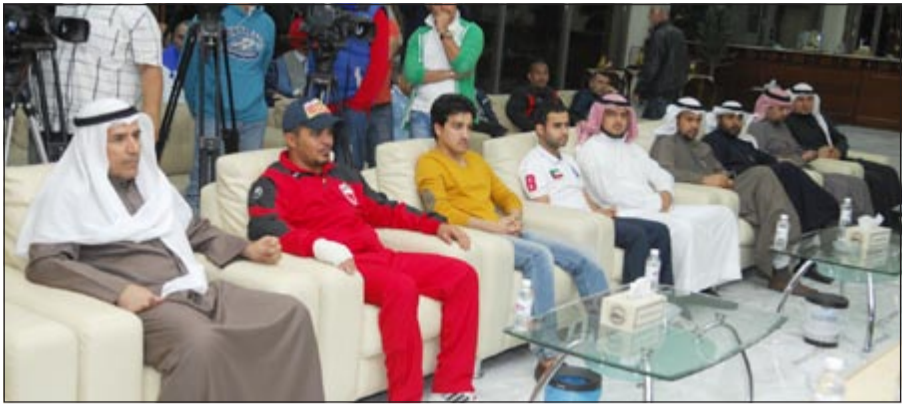
عدد من الحضور خلال التكرم