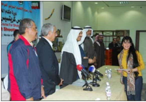
ويكرم حكمت الرماية