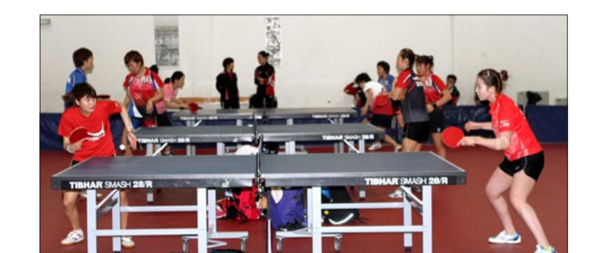
المنتخبات بدأت بالتدريب على صالة نادي الكويت