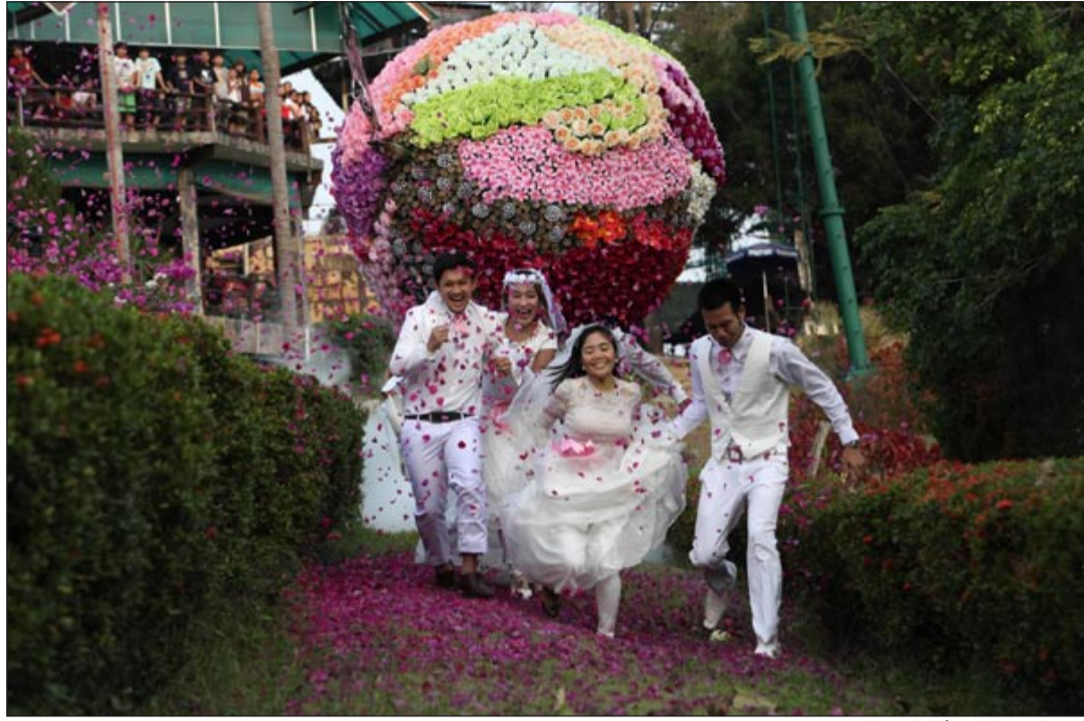
عروسان في بانكوك أثناء الاحتفال

وتقدم ذلك للمرة الأولى في هواتف نوكيا الذكية ميزة استخدام شريحتي اتصال ودعم لشبكات واي فاي في الجهاز نفسه للمستخدم أفضل ما في العالمين من خلال توفير المرونة للاستمتاع بالمزيد من تجربة التنقل مع التحكم بالكثافة، ويقدم الهاتف أيضاً مجموعة كبيرة من التطبيقات والألعاب الرائعة والتي تعتبر السمة المميزة لسلسلة هواتف «أشا» الذكية. وأصبح بالإمكان الآن استخدام الماخذ الخارجي لشريحة الاتصال في هاتف Asha 310 لإضافة الشريحة الثانية وذلك بفضل تقنية Dual SIM Easy Swap من نوكيا والحفاظ على الشريحة الرئيسية في مكانها خلف البطارية. ويسمح هاتف Asha 310 للمستخدم التحكم في الجهاز نفسه للمستخدم أفضل ما في العالمين من خلال توفير المرونة للاستمتاع بالمزيد من تجربة التنقل مع التحكم بالكثافة، ويقدم الهاتف أيضاً مجموعة كبيرة من التطبيقات والألعاب الرائعة والتي تعتبر السمة المميزة لسلسلة هواتف «أشا» الذكية.