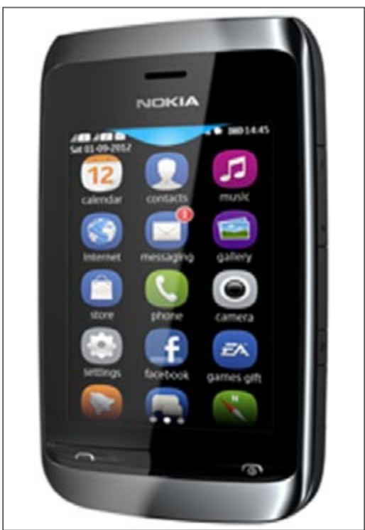
هاتف 310 Asha

وكالات: كشفت شركة نوكيا النقاب عن هاتف Asha 310، وهو الهاتف الذكي الجديد الذي يدعم استخدام شريحتي اتصال وشبكات واي فاي اللاسلكية، وذلك لمساعدة المستخدمين على أداء المزيد عبر الإنترنت وبكفاءة أقل.