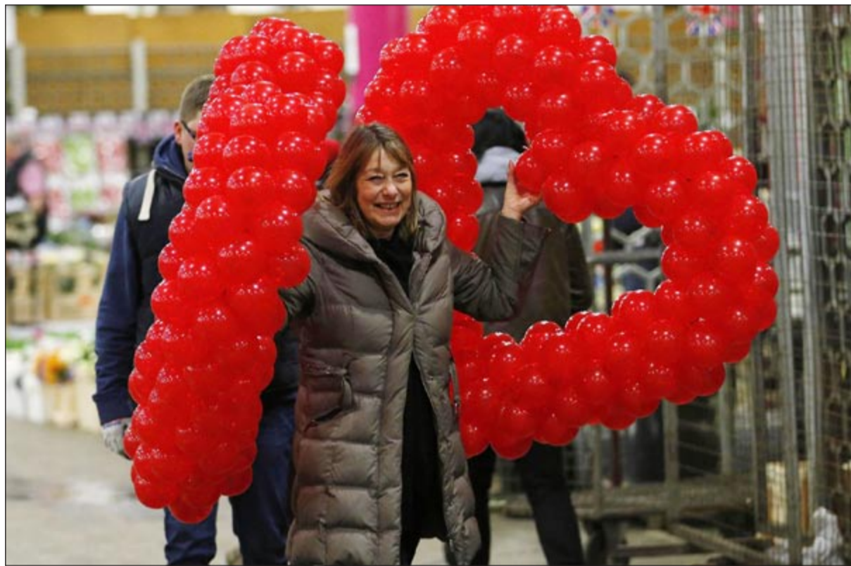
قلبان من البالونات مع سيدة بريطانية

طن من الزهور الحمراء قادمة من أفريقيا وأمريكا الجنوبية. وأعلنت شركة لوفتهانزا الألمانية للشحن أنها نقلت على متن 13 طائرة شحن ملايين من الزهور يوم عيد الحب. بينما ابتكرت شركة يابانية طريقة جديدة للتعبير عن المشاعر في عيد الحب وعرضت على من يريد أن يقول لشريكه «أنا لك» قالباً ثلاثي الأبعاد للوجه مصنوعاً من الشوكولاتة، بل مكنتهم من ادخال بعض التحسينات على ملامح الوجه على شاشة كمبيوتر قبل إعطاء الأمر إلى الطباعة ثلاثية الأبعاد في خطوة تسبق تشكيل القالب.