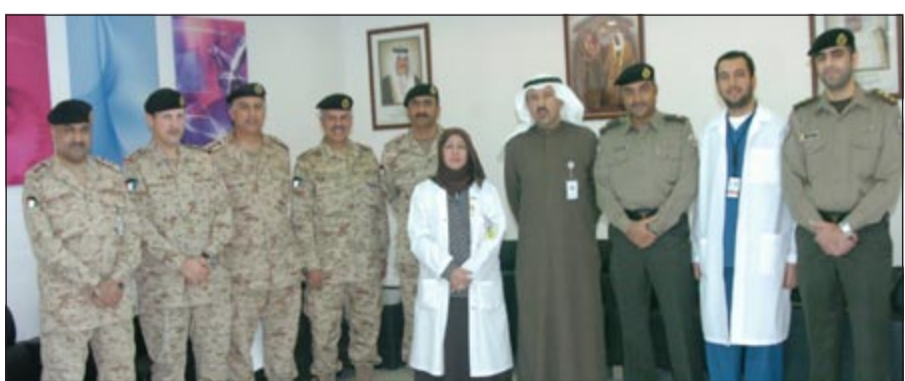
د.يوسف النصف متوسلاً بعض مسؤولي المستشفى والعمالين فيه

تحت رعاية رئيس هيئة الخدمات الطبية د.يوسف النصف، أقيم في مستشفى جابر الأحمد للقوات المسلحة حفل افتتاح وحدة استقبال الأشعة المقطعية ووحدة أشعة الثدي التي تعتبر نقلة نوعية في مجال الخدمات الطبية المقدمة في مستشفى العسكري. وتعتبر هذه المرحلة من مراحل الانجازات المهمة المتعلقة بقسم الأشعة التشخيصية لتوفير خدمات