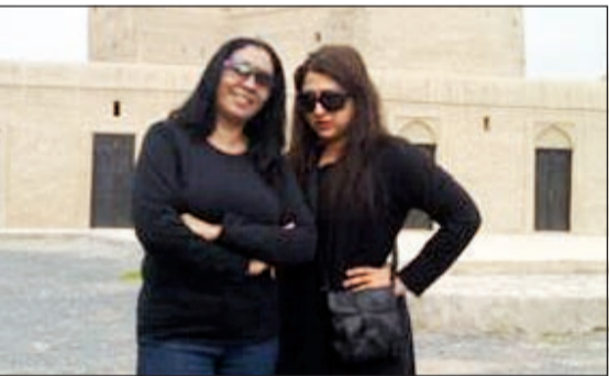
..مع الفنانة الإماراتية هدى الغانم