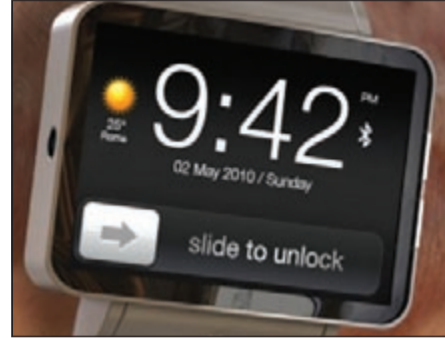
ساعة أبل الذكية

كاليفورنيا - أ.ش.أ: زعمت تقارير صحافية نشرت مؤخرا على الإنترنت أن شركة «أبل» الأميركية، رائدة صناعة الحاسبات والهواتف الذكية، تختبر حالياً ساعة رقمية جديدة ذات تصميم زجاجي منحني. وذكرت صحيفة «نيويورك تايمز» الأميركية أن جهاز «أبل» المزمع، والذي أطلق عليه اسم «آي ووتش»، سيدخل مرحلة الإنتاج الفعلي أوائل العام الحالي.