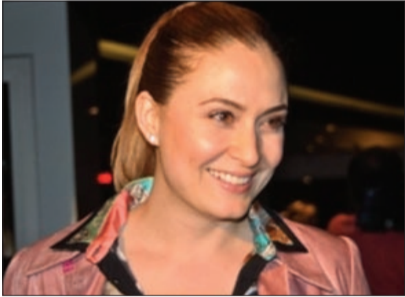
جيدة دوفنجي الشهيرة بـ «رفيف»

جيدة دوفنجي تزوجت للمرة الأولى من الممثل كعان جرجين عام 2000 واعتزلت