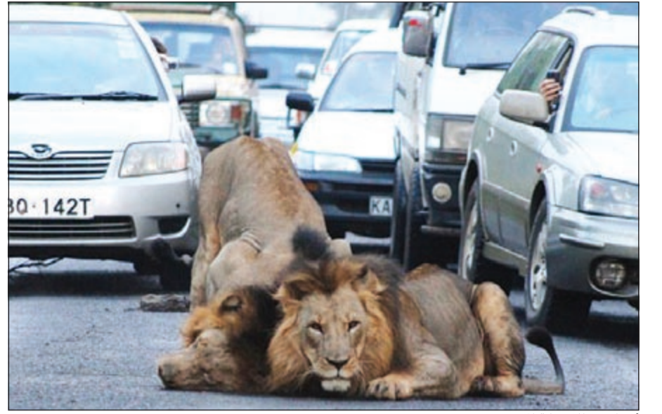
أسدان يعطلان حركة المرور

دقائق، ثم رحل الأسدان إلى داخل الحديقة». من جهة أخرى قررت السلطات المحلية إغلاق أحد الشوارع بمدينة باث البريطانية لمدة 6 أسابيع لمساعدة صغار الضفادع من سلالة أموروس على العودة إلى أرض خصوبتها بسلامة.