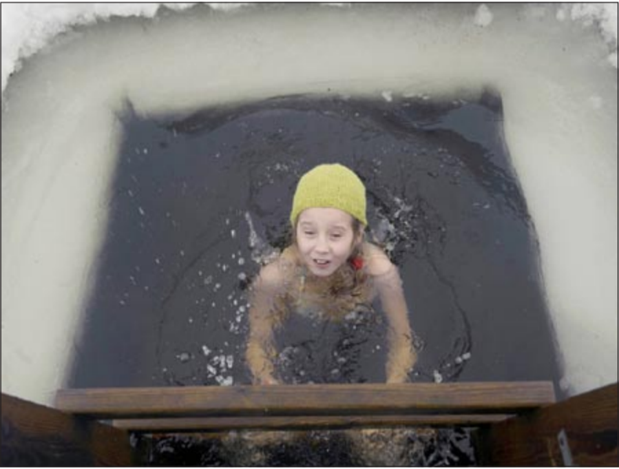
طفلة تشارك في الماراثون

مع كل محطة إضافية بزورها، يهدف المسابقة لا يقتصر على إنهاء الجولة بأسرع وقت ممكن».