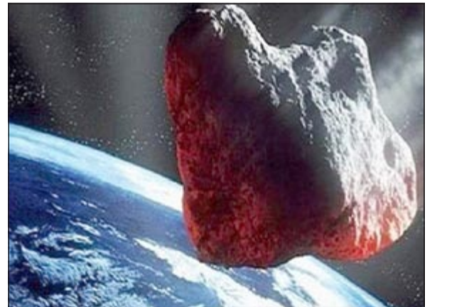
محاكاة تصويرية للكويكب عند اقترابه

الكويكب 2012 DA14 صغير نسبياً، لكنه صخرة عملاقة قطرها 45 متراً، واكتشفه