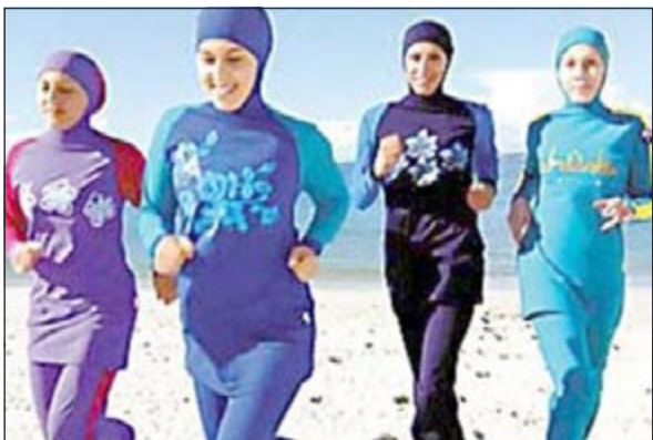
لباس البحر الإسلامي المحتشم

الوجه واليدين والقدمين على دفعة كبيرة بعد أن ظهرت مذيعة تلفزيونية استرالية وهي ترثديه في أحد برامج الواقع الشهيرة التي ترصد الأحداث على شاطئ بوندي بأستراليا في أبريل 2011. وقال مدير المبيعات بشركة مودستي اكتيف أنه كان يتم استيراد هذا اللباس من تركيا والمغرب ويقبل عليه السيدات المسلمات فقط، وبدأت شركته بانتاجه في بريطانيا عام