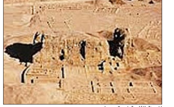
المدينة الأثرية في السودان