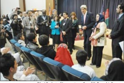
وزير الخارجية الأمريكي يتحدث لأعضاء الفرقة