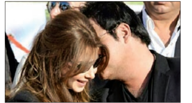
صورة لعاصي الحلاني يهمس في أذن نانسي عجرم

والبعض الآخر رجح، بحسب موقع «ام بي سي»، أن يكون عاصي قد داعب نانسي بقوله إن البرنامج الذي تشارك فيه لن يستطيع تجاوز شهرة برنامجها.