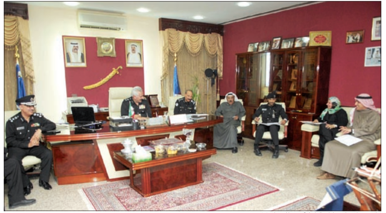
جانب من اجتماع قيادات الداخلية مع هلا فبراير 2013