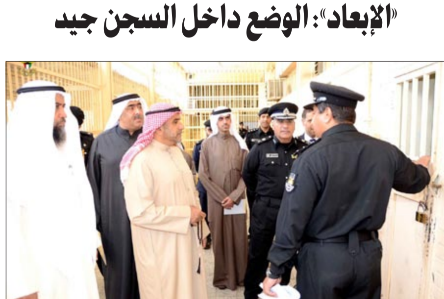
مدير السجن يشرح لأعضاء اللجنة