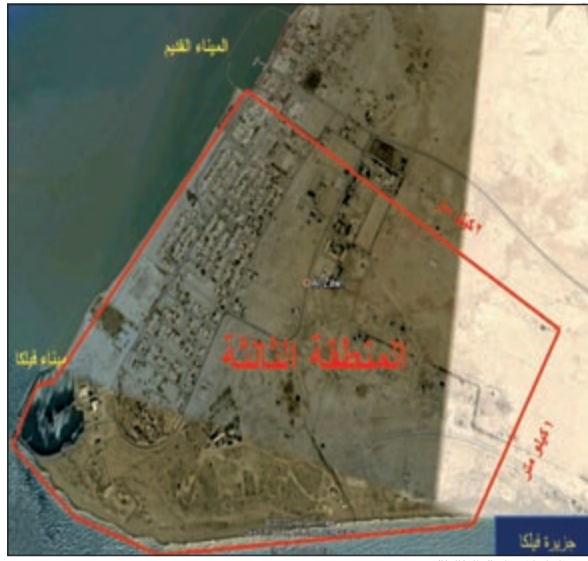
مخطط المنطقة الثالثة