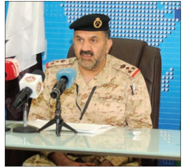
العميد عبدالعزيز الرئيس متحدثا خلال المؤتمر الصحافي (هاني الشمري)