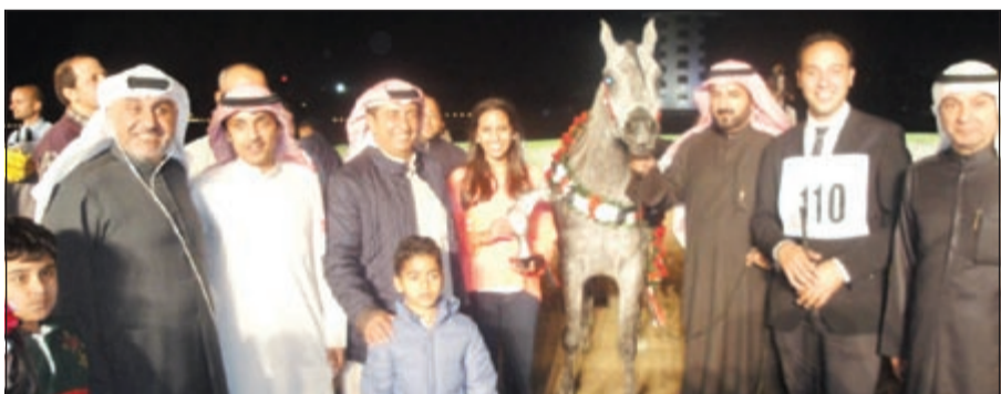
فرقة الاسطبل الفائق بالمهرجان مع باقي المشاركين

'مزينة' للرومي و«عنان الصافات» ومزرعة الفياض نجوم مهرجان الكويت الأول لجمال الخيل العربية المنتجة محلياً