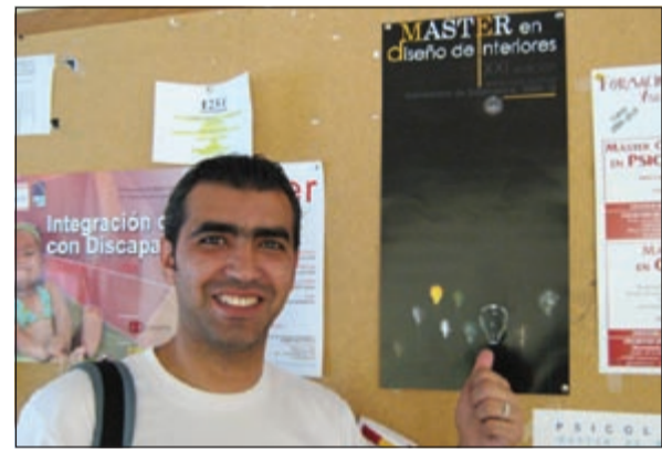
الرباح بصورة تذكارية مع «بوستر» جامعة سلمنكا الذي صممه