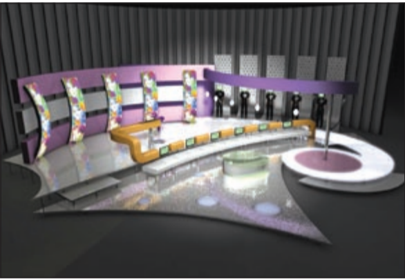
تصميم برنامج «الو حليلة» على روتانا خليجية