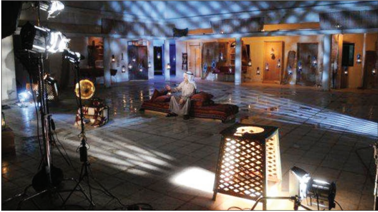
art director لاغنية محمد المسباح «برد ودفا»