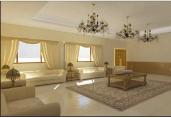
تصميم قاعة كبار الضيوف للمعهد العالي للفنون الموسيقية

الفكرة تعبير عن حب الشعب لحكامه. يتقسم تصميم الكرسي الى جزأين متشابهين بالشكل، مختلفين في المعنى بعرض لا يتجاوز 160 سنتيمترا، وارتفاع لا يتجاوز 180 سنتيمترا، وعمق 90 سنتيمترا ويتم تصنيعه من الخشب الصالح المرصع بالذهب الخالص.