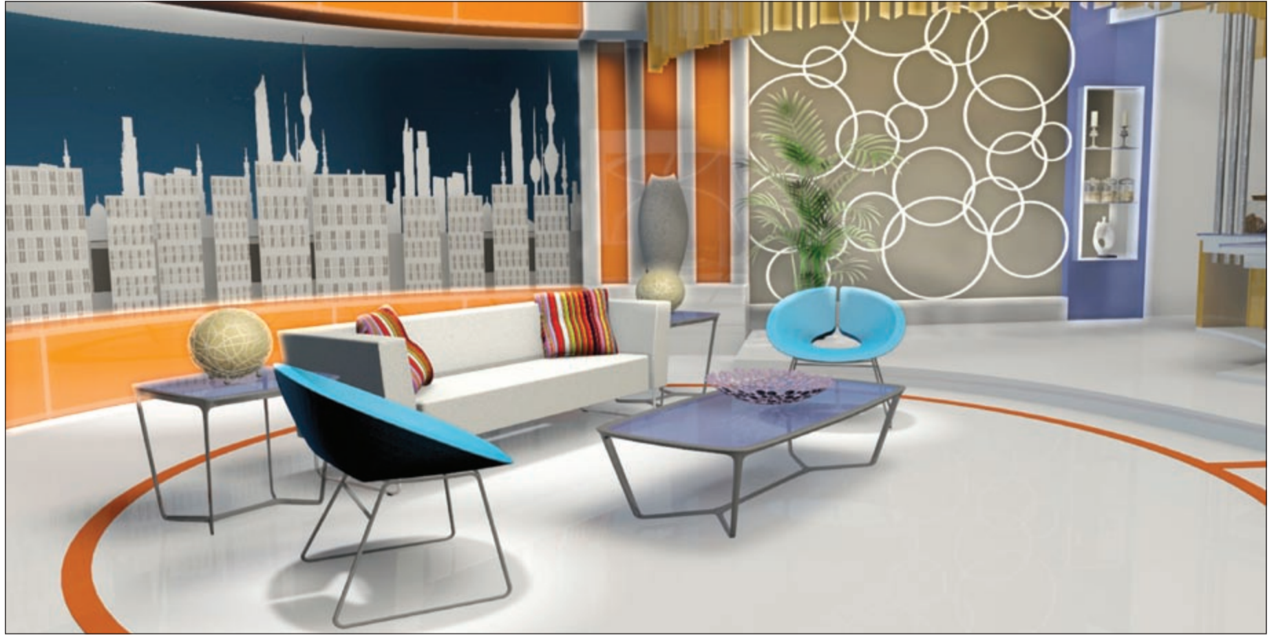
ديكور برنامج «صباح الخير يا كويت» للتلفزيون الكويت