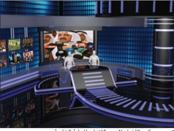
تصميم ديكور الأخبار لإحدى القنوات المحلية الخاصة