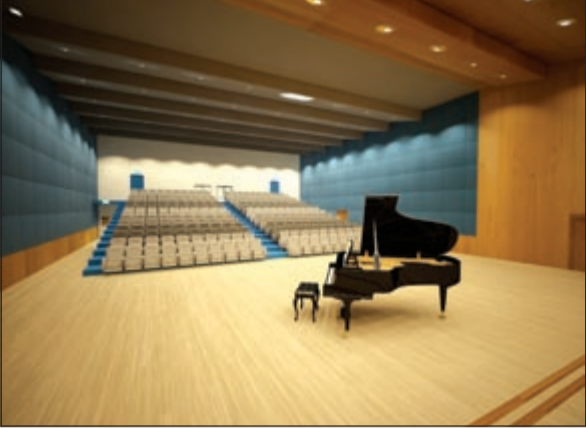
تصميم مسرح موسيقي