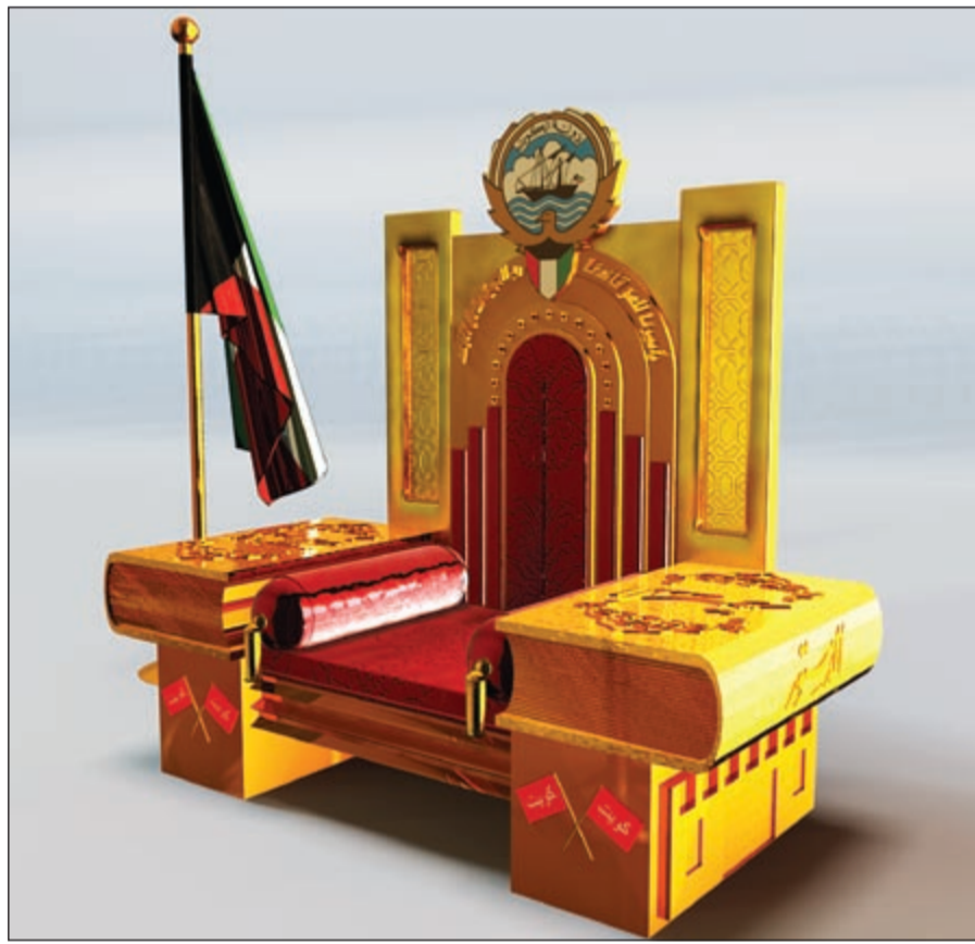
تصميم «دفة السيف»