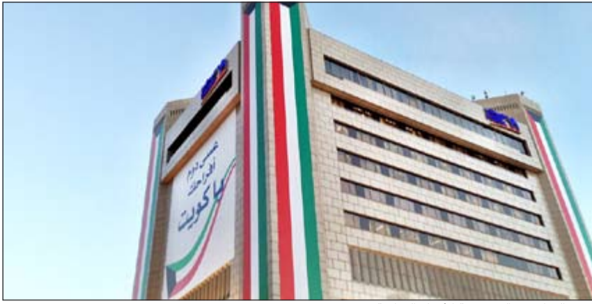
البنك الوطني يواكب فرحة الأعياد الوطنية