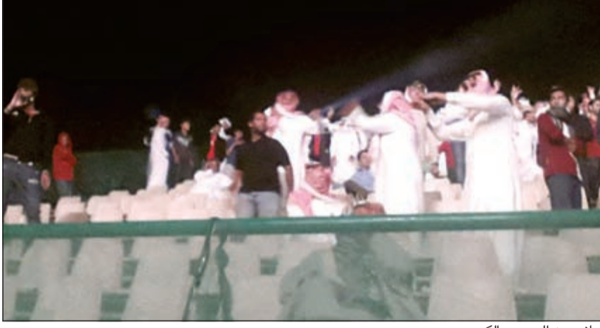
جانب من الجمهور الكبير