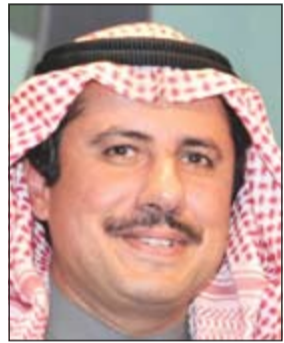
الشيخ عزام الصباح

أكد سفيرنا لدى مملكة البحرين الشيخ عزام الصباح أن العلاقات الكويتية - البحرينية عميقة ومتأصلة على جميع المستويات وأن الكويت والبحرين فضاء واحد. وقال السفير عزام في تصريح صحفي على هامس زيارة سيقوم بها وفد من مجلس الأمة الكويتي إلى البحرين اليوم ان الوفد الذي سيزور مملكة البحرين اليوم