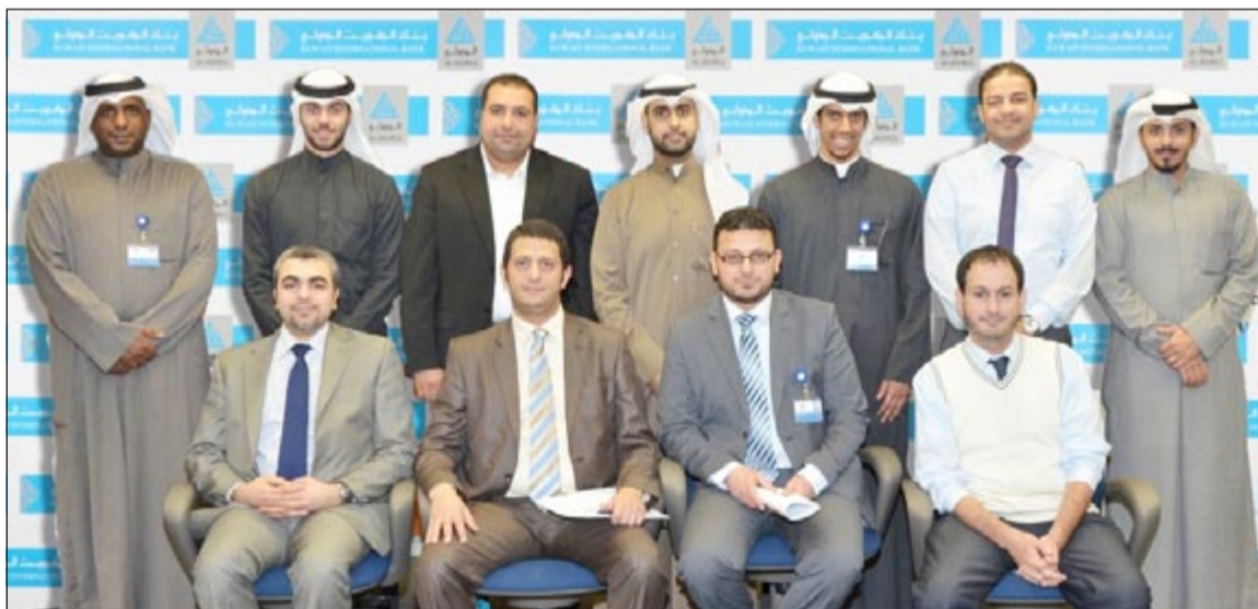
لقطة جماعية للمشاركين في الدورة التدريبية

دورة تدريبية الكويتية لجمعية من موظفيه حول الأساسيات الشرعية للعمل المصرفي الإسلامي ومنتجاته، وذلك ضمن سلسلة البرامج التدريبية التي ينفذها البنك حالياً لتطوير كوادره الإدارية والقيادية. وذكر «الدولي» في بيان صحافي أن المناهج التي يعتمد عليها في خطته وبرامجه التدريبية تعكس طموحاته في تطوير خدماته المصرفية وتطوير مهارات موظفيه لمواكبة استراتيجيته المستقبلية وقد عقدت هذه الدورة انطلاقاً من حرصه على إكساب موظفيه خبرات مهنية متميزة تؤهلهم لمواكبة التطور الهائل في الصناعة المصرفية الإسلامية. المترافق مع الإقبال الكبير على الخدمات المصرفية الإسلامية. وأشار البنك إلى أن دورة الأساسيات الشرعية للعمل