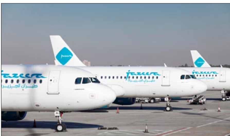
خطط لرفع أسطول طائرات «الجزيرة» إلى 14 طائرة خلال العام الجاري

وأكد بوذي بالقول: «لولا التعاون والدعم الكبير الذي حظينا به من الإدارة العامة للطيران المدني الكويتي، لما كنا استطعنا تحقيق هذه الإنجازات خلال العام الماضي. ونشكر الطيران المدني على جميع جهودها، كما نتوجه بالشكر لشركائنا ومزودي الخدمات الخارجية، وأيضاً تشجيع الحكومة الكويتية في نجاح «طيران الجزيرة» والعاملين في الشركة، وتعكس