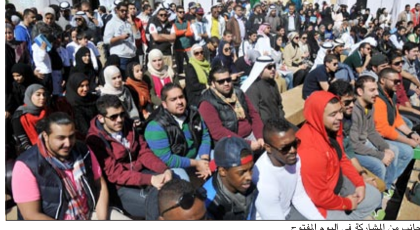
جانب من المشاركة في اليوم المفتوح

قدر ممكن، كما أن الإدارة الجامعية تخصص يوماً مفتوحاً كل عام ونستغله بالجانب الترفيهي للطلبة، وأضاف الرفاعي أنه بمناسبة قرب حلول الأعياد الوطنية جعلنا جانباً من اليوم المفتوح للفعلات والفعاليات الوطنية كما نتفقنا مع أكثر من 25 مطعماً لتغطية اليوم المفتوح بالمجان للطلبة كما نظمنا العديد من المسابقات وخصصنا جوائز للفائزين وأشار الرفاعي إلى أن الحدث الرئيسي لليوم المفتوح هو إقامة مسرحية تحت عنوان (متى يوصل) تقدم معنى للوحدة الوطنية بطريقة كوميدية وشكرو الرفاعي الداعمين لليوم المفتوح شركة زين للاتصالات ومجموعة الزاحم العالمية.