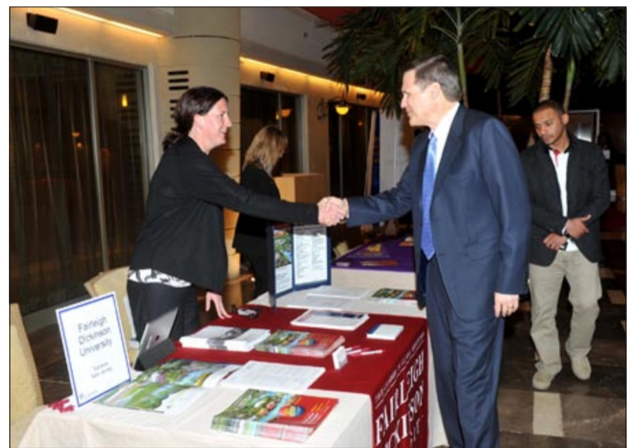
السفير متفقد أحد أجنحة المعرض

الاميركية وتشمل كل مستويات الدراسة مثل البكالوريوس والماجستير والدكتوراه وهذا المعرض كان مفتوحاً لجميع المواطنين والمقيمين في الكويت ويقام اليوم واحد فقط.